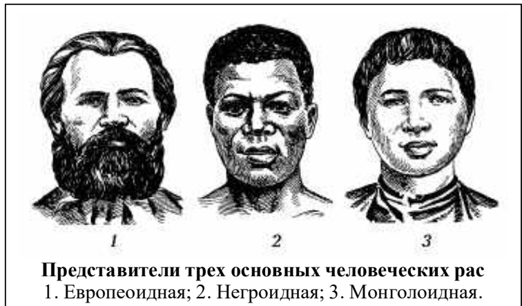
Представители трех основных человеческих рас 1. Европеоидная; 2. Негроидная; 3. Монголоидная.

Если сравнить процесс разделение человека на расы с тем, что написано в Библии, мы сможем найти много схожего. По Библии, после Всемирного потопа "населилась вся земля" сыновьями Ноя : Симом , Хамом , Иафетом . От этих сыновей произошли три большие группы народов: