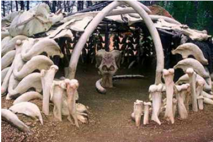
Жилище из костей мамонта

шкур они добывали, охотясь на мамонтов, шерстистых носорогов, бизонов, оленей и других животных. Из бивней мамонта и оленьих рогов кроманьонцы научились делать орудия. Из костей мамонта они строили дома. Фундамент такого дома складывали из черепов огромных животных.