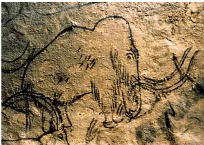
Древнейшее изображение мамонта

Древние люди понимали, что у каждого человека есть ДУША, делающая человека живым и мыслящим существом. Люди ощущали, что когда человек физически умирает, его душа покидает тело, но продолжает жить. Они верили в загробную жизнь и при погребении умершего человека стремились обеспечить его всем тем, в чём он нуждался при жизни.