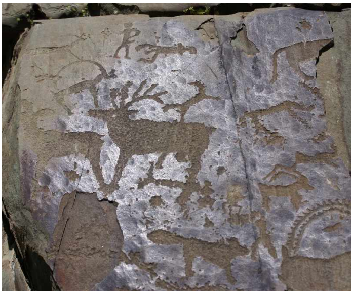
Рисунки, высеченные на скале в селении Калбак-Таш, на Алтае. Около V тыс. лет до нашей эры.

Первобытные люди особо почитали предков. По их представлениям, предком рода мог быть не только человек, но и растение или животное, например медведь или волк.