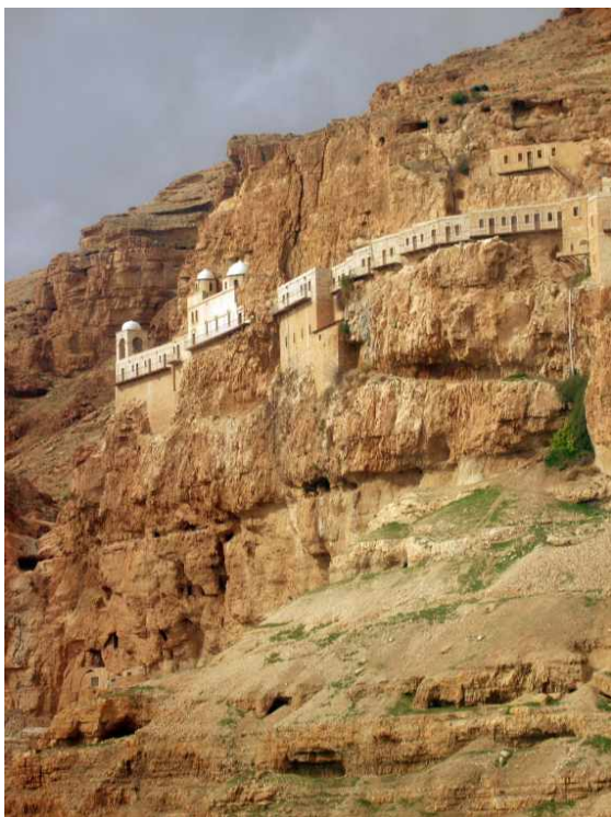
Гора «Искушений» в Иерихоне, где по преданию, Иисус Христос постился 40 дней, искушаемый дьяволом

Древнейшие города. На юго-восточном побережье Средиземного