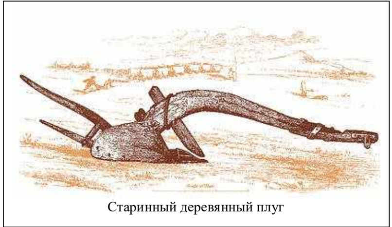
Старинный деревянный плуг

Первоначально люди обрабатывали землю с помощью мотыги . Затем люди изобрели деревянный плуг , который позволил упростить обработку земли. В плуг впрягали волов, а затем лошадей. С помощью плуга стало возможным вспахивать трудные почвы. Площади посевных земель значительно расширились. В результате люди начали собирать больше урожая и делать запасы зерна на зиму.