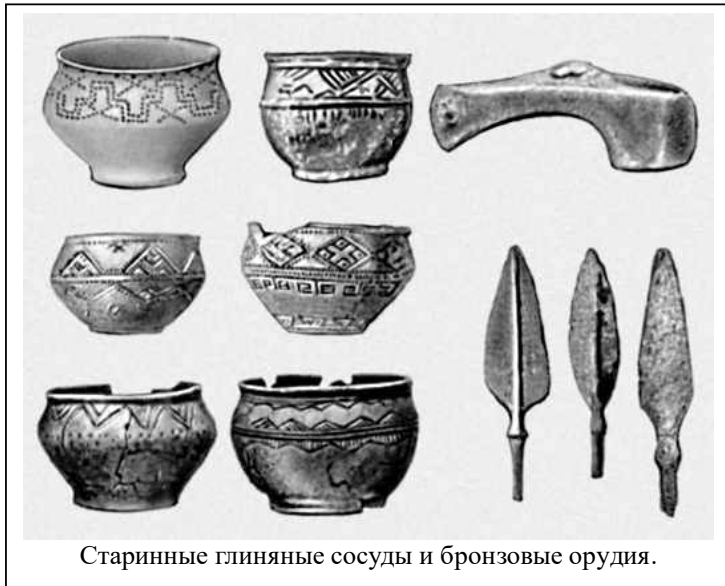
Старинные глиняные сосуды и бронзовые орудия.

От бронзового века к железному. Первым металлом, который