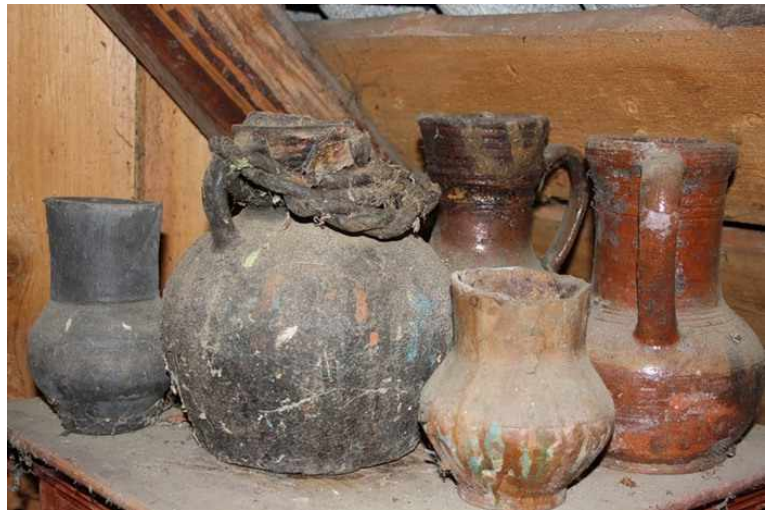
Старинные кувшины из глины

Посуда из глины. В период неолита люди научились делать посуду из глины. Сначала они плели корзины из прутьев, а затем стали обмазывать их глиной. Глина засыхала, и в таком сосуде можно было хранить продукты. Но если в него наливали воду, глина размокала, и сосуд приходил в негодность. Тогда люди стали обжигать глиняные сосуды на огне. Так появилась керамика. Мастера украшали глиняную посуду узорами и орнаментом .