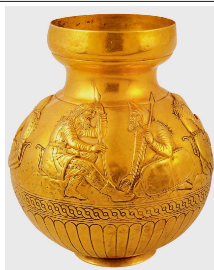
Чаша из кургана Куль-Оба, изображающая быт скифов

Как бы то ни было, постепенно вытесняя скифов и сарматов, и (или)