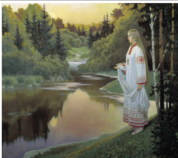
Славянка. Художник Б.Ольшанский