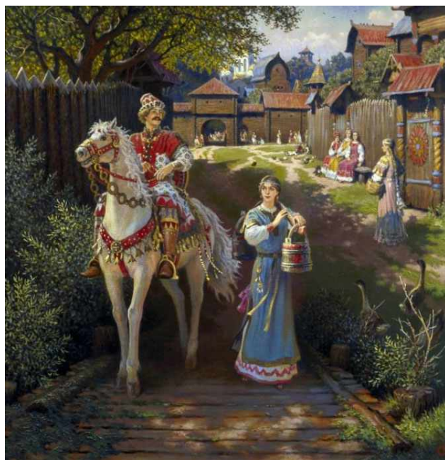
Из жизни славян. Художник Б.Ольшанский

Славянские имена и названия городов часто включали в себя корень «слав»: Боле-слав, Влади-слав, Вече-слав, Любо-слав, Мсти-слав, Миро-слав, Рості-слав, Свято-слав, Яро-слав, Яро-славль, Рос-славль, Слав-енск и другие. Это говорит в пользу того, что название славян произошло от «слава», а не от «слово», да и буква «а» в слове «славяне» это подтверждает.