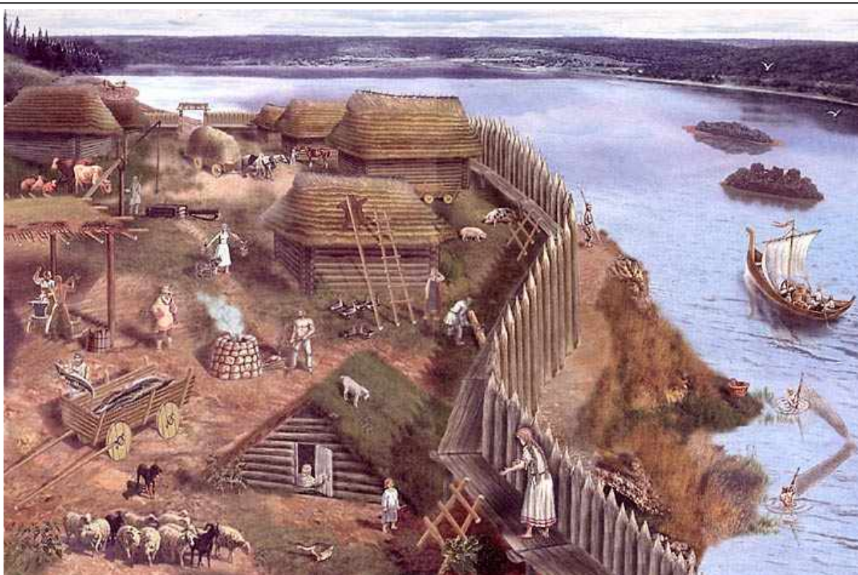
Поселение древних славян

Славяне стремились к оседлой жизни: строили дома, занимались земледелием и животноводством, и были очень гостеприимным народом. У них считалось позором не угостить гостя или не пустить его переночевать к себе в дом. Когда путник уходил, они обеспечивали ему охрану в дальнейшем пути.