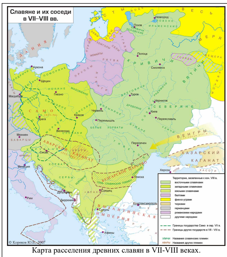
Карта расселения древних славян в VII-VIII веках.

Как бы то ни было, со временем, арии начали распространяться во все стороны света. Сливаясь с местными племенами, они давали начало многим народам Европы и Азии .