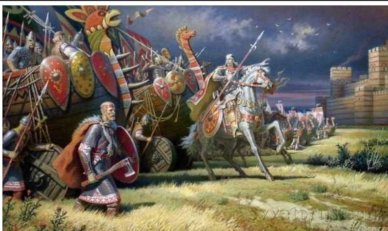
Поход Олега на Царьград. Художник Б.Ольшанский

Тогда он решил его взять с суши. Он повелел своим воинам сделать колёса и