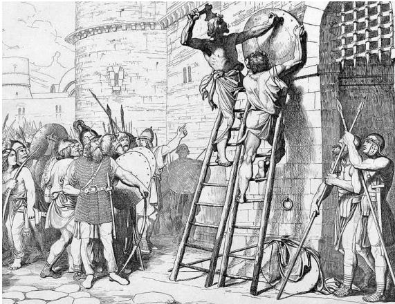
Воины князя Олега прибивают щиты на ворота Царьграда.

поставить на эти колёса ладьи. Когда подул попутный ветер, ладьи покатались по полю в сторону города. Испуганные греки предложили Олегу мир и дань. В знак победы над греками воины Олега прибили свои щиты на ворота Царьграда. После похода Олега на Византию его стали называть ВЕЩИМ, что означает – знающий будущее.