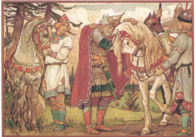
Прощание Вещего Олега с конем. Художник В.Васнецов

волхвы предсказали князю, что он умрёт от своего любимого коня. Олег очень любил своего коня, поэтому приказал увести его и хорошо за ним ухаживать. Через четыре года Олег захотел повидаться с конем, но тот к этому времени уже давно умер. Придя на место, где покоились останки коня, Олег посмеялся над волхвами и, встав ногой на череп, сказал: «Его ли мне бояться?» Однако в черепе коня жила ядовитая змея, которая смертельно ужалила князя. От укуса змеи Олег скончался. Таким образом «осуществилось» предсказание волхвов о том, что он «умрёт от своего любимого коня».