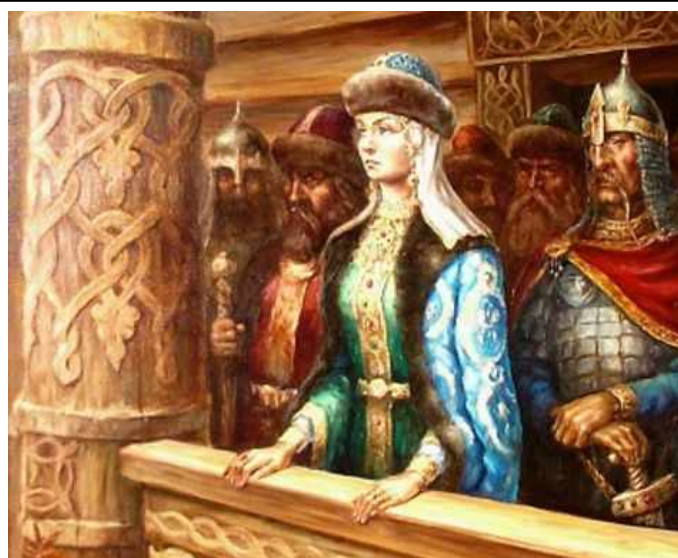
Княгиня Ольга ждет возвращения Игоря

Переправляясь через реку на лодке, он заметил, что перевозчиком была юная девушка, переодетая в мужскую одежду. Игорь обратил внимание на её красоту и попытался соблазнить девушку. Но в ответ он получил достойную отповедь: «Зачем смущаешь меня, княже, нескромными словами? Пусть я молода и незнатна, и одна здесь, но знай: лучше для