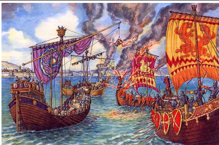
Битва князя Игоря с византийцами. Греческий огонь.

достатком, стала настаивать на том, чтобы снова идти собирать дань у