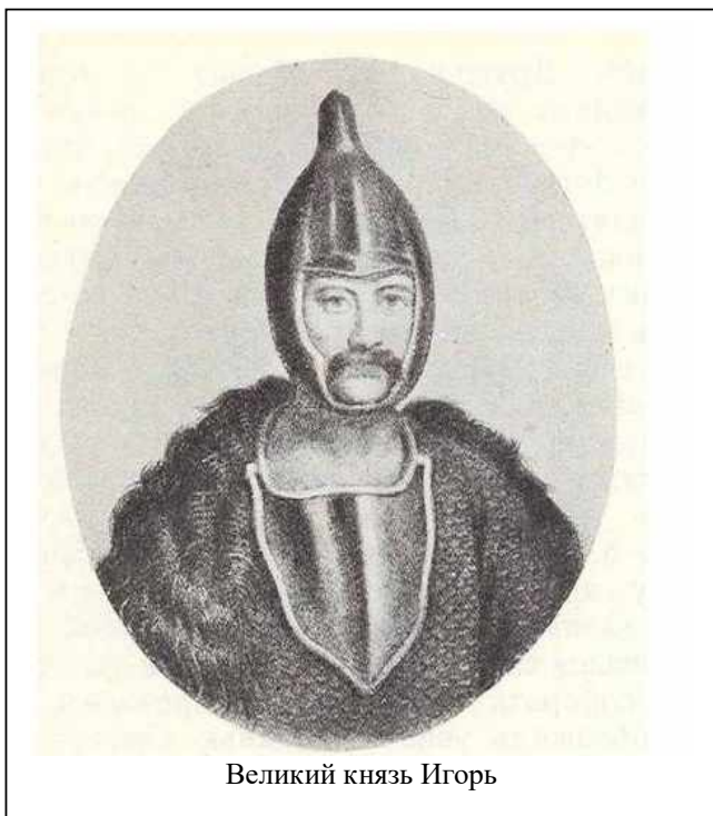
Великий князь Игорь

После смерти князя Олега (912), Великим князем киевским стал ИГОРЬ – сын Рюрика. Он был уже довольно зрелого возраста, но воспитанный Олегом в повиновении, смотрел на него как на законного государя, несмотря на свое право быть преемником своего отца – князя Рюрика.