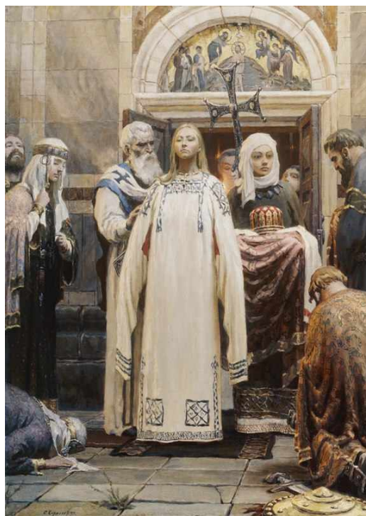
Крещение княгини Ольги

Но самым значимым событием в биографии Ольги было принятие ею Православия. В крещении она получила имя Елена. Княгиня Ольга стала первым правителем Киевской Руси, официально принявшим