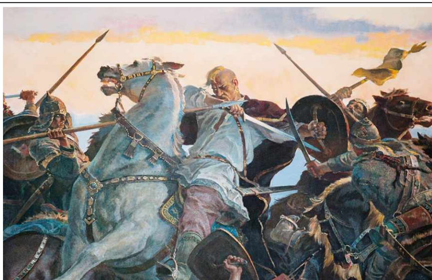
Последний бой Святослава. Художник Н. Овечкин

Воевода Свенельд говорил ему: «Обойди, князь, пороги на конях, ибо стоят у порогов печенеги». Но князь не послушал его и поплыл на ладьях. ПЕЧЕНЕГИ подкараулили небольшой отряд Святослава и разбили его. В схватке Святослав погиб. Случилось это в 972 году. Воевода Свенельд