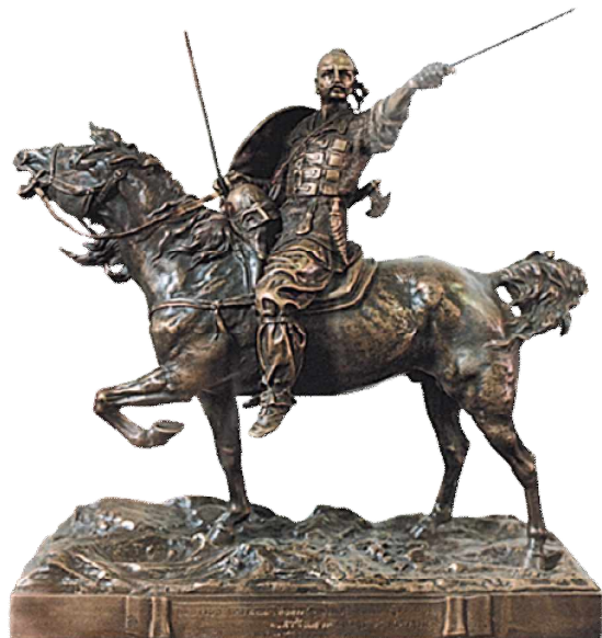
Князь Святослав на пути к Царьграду. Скульптор Е.Лансере

В походах Святослав не возил с собой котлов и тяжёлых обозов. Он даже не имел своего шатра, а спал на земле, подстелив под себя конскую накидку (потник) и положив под голову конское седло. Питался он ломтиками конины или других зверей, зажарив их на углях. Такими же были и все остальные его воины.