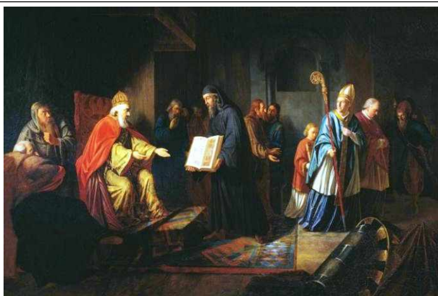
Великий князь Владимир избирает религию. Худ. И. Эггинк

чтобы они узнали на месте, какая вера лучше. После возвращения в Киев, они рассказали князю всё что видели. И все они говорили, что лучше греческой веры нет нигде ни у какого народа: "Когда мы стояли во время службы в греческом храме, то мы не знали, где находимся: на небе или на земле".