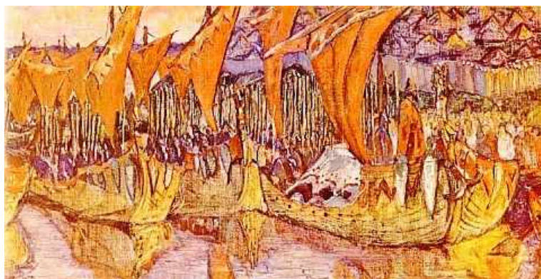
Поход князя Владимира на Корсунь.

Киевом, византийский император обратился к Владимиру за помощью. Князь согласился оказать помощь, но взамен потребовал, чтобы император отдал за него замуж свою дочь Анну. Император дал своё согласие, но поставил условие: Владимир должен был сам креститься в православие и крестить свою страну.