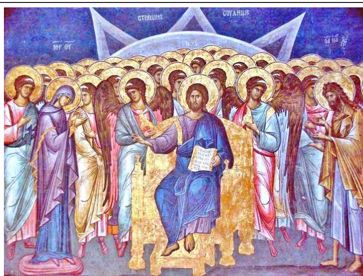
Страшный суд. Фреска.

Однако с принятием решения князь Владимир не торопился. По совету бояр ОН ОТПРАВИЛ ДЕСЯТЬ МУДРЫХ ПОСЛОВ В РАЗНЫЕ СТРАНЫ,