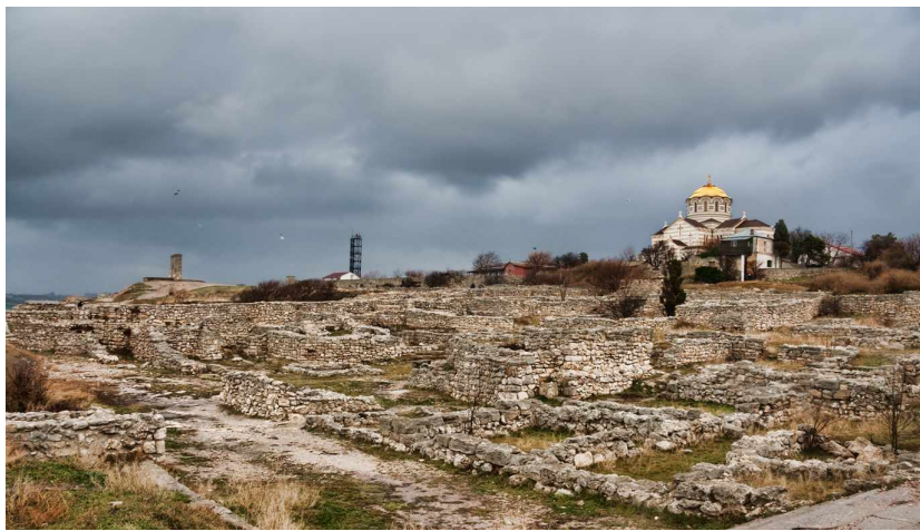
Руины Херсонеса в современном Севастополе с собором св. Владимира.

Важно отметить, что в ту пору ему было всего 28 лет. В таком