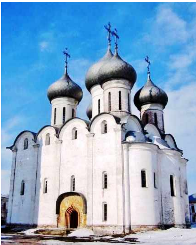
Софийский собор. Новгород, XI век.