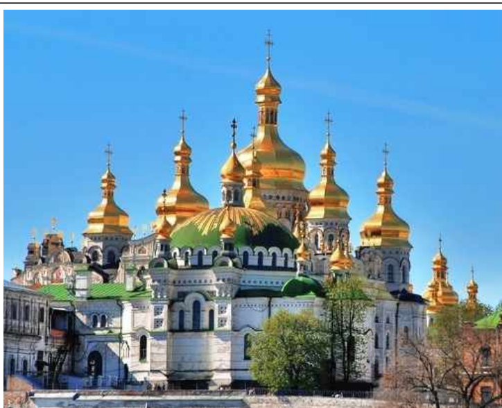
Киево-Печерская лавра. Современный вид.