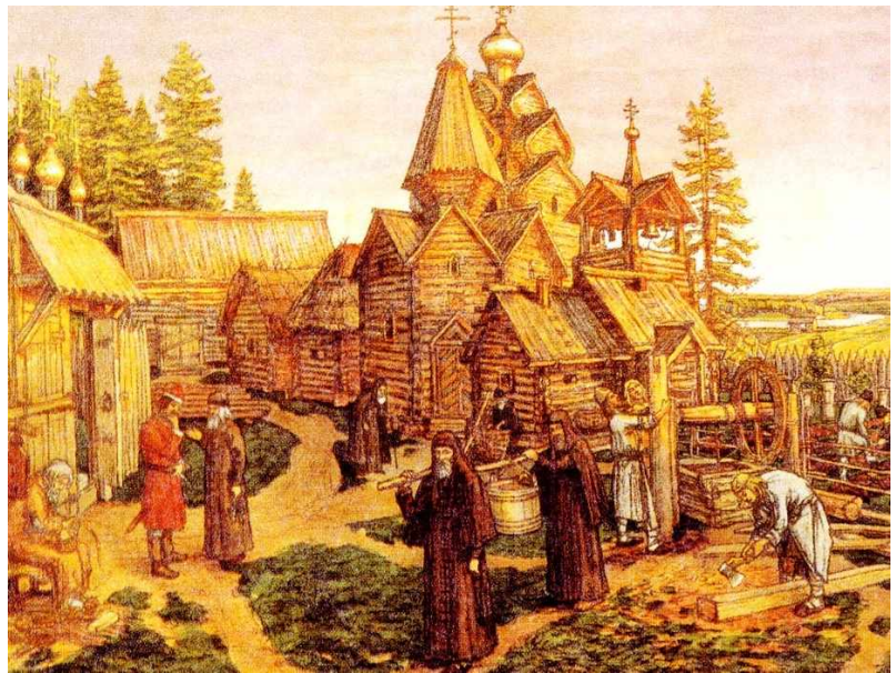
Монастырь в Древней Руси. Художник А.М. Васнецов

После принятия Русью Православия князь Владимир