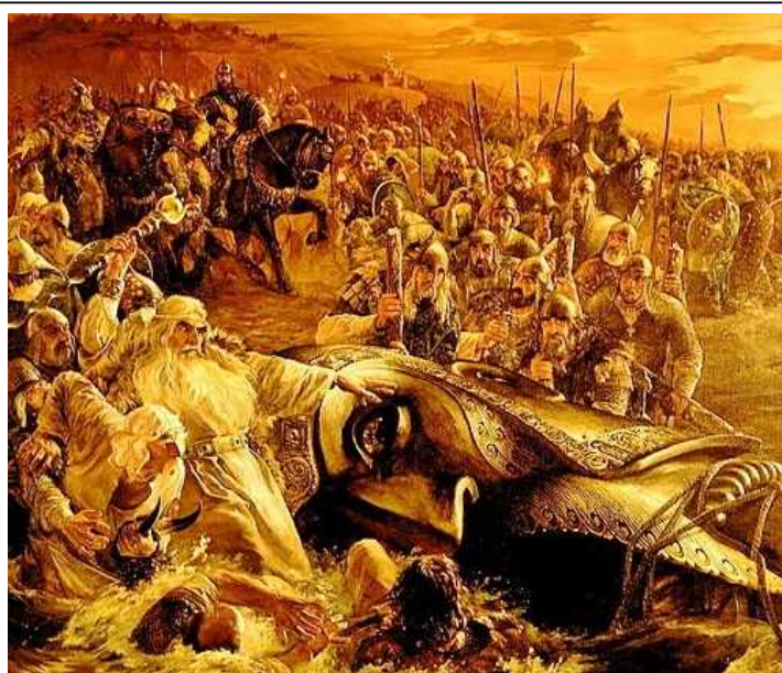
Низвержение Перуна. Худ. В.Назорук

После этого Владимир разослал киевлянам указ явиться всем в назначенный час к берегу Днепра. В указе говорилось: «Если кто, богатый или бедный, нищий или раб, не окажется завтра на реке, тот будет