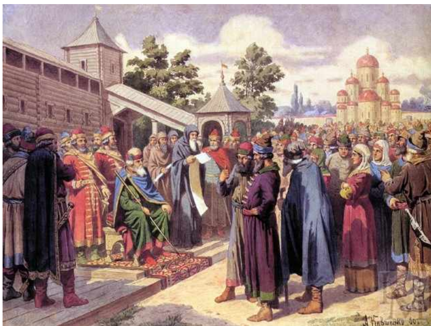
Чтение Русской Правды в присутствии князя Ярослава. Худ. А.Кившенко