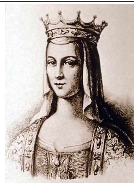
Анна Ярославна – королева Франции (1024-1075)

Если какой-нибудь князь умирал, не дождавшись киевского княжения, то его дети НЕ ПОЛУЧАЛИ УДЕЛА, а поступали служить к другим князьям и назывались ИЗГОЯМИ.