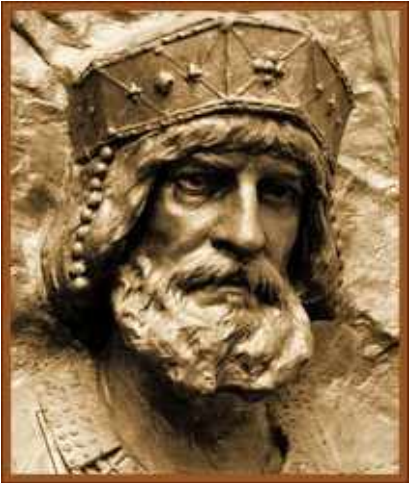
Ярослав Владимирович Мудрый. Барельеф.

Приняв Православную веру при князе Владимире, люди Киевской Руси полюбили христианскую веру. Наиболее благочестивых христиан церковь причисляла к лику святых. С некоторыми из них мы уже знакомились на предыдущих уроках: святая КНЯГИНЯ ОЛЬГА первая приняла христианство; первые мученики ФЕДОР и его сын ИОАНН, были сожжены в своём доме за отказ принести в жертву идолам Иоанна; святой князь ВЛАДИМИР крестил Русь; преподобные монахи АНТОНИЙ и ФЕОДОСИЙ основали Киево-Печерскую Лавру.