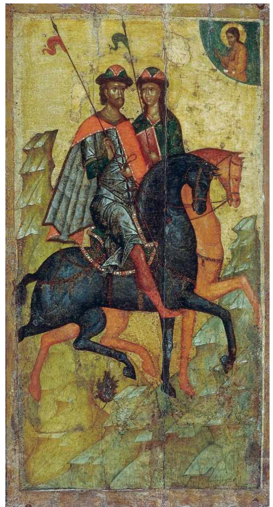
Св. Борис и Глеб на конях. Икона XIV века.

Князь Ярослав, ещё один сын Владимира, рассердился на Святополка и не мог простить ему убийство братьев. Он пошёл на него войной, и поначалу ему удалось прогнать