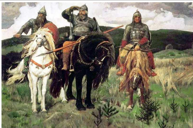
Три богатыря: Илья Муромец, Добрыня Никитич и Алёша Попович. Худ. А. Васнецов

Любимыми былинными героями стали крестьянский сын, бесстрашный и могучий воин ИЛЬЯ МУРОМЕЦ, рассудительный и справедливый Добрыня Никитич , весёлый и сметливый Алёша Попович .