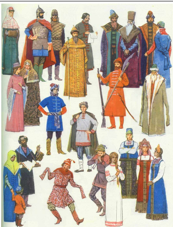
Так одевались люди Древней Руси.

Основой древнерусской культуры стало наследие восточных славян, древние мифы и сказания, традиции резьбы по дереву и камню, искусство кузнецов и т.д. Древнерусская культура впитывала в себя также культурные