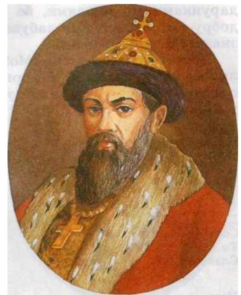
Великий князь Владимир Мономах

выгодную торговлю с Византией, поскольку половцы перекрыли путь на юг по Днепру. Собралось вече, на котором было принято решение –