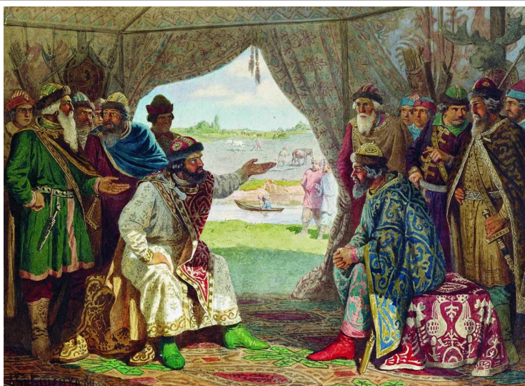
Долобский съезд князей – свидание князя Владимира Мономаха с князем Святополком. Худ. А. Д. Кившенко.

Борьба с половцами. В 1103 году у Долобского озера близи Киева состоялся еще один съезд русских князей, получивший в истории название – Долобский . В этом съезде принимали участие не только князья, но и дружинники. Достигнутые на съезде соглашения позволили русским князьям совершить несколько крупных совместных походов. В 1103 г. дружины князей Святополка и Владимира Мономаха одержали победу над кочевниками в сражении при Сутени . В этой битве погибли 20 половецких ханов. В 1111 г. в верховьях Северного Донца