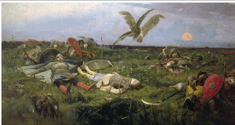
После побоища Игоря Святославича с половцами. Худ. В.М. Васнецов

Прославился своей борьбой с половцами и князь Новгород-Северский Игорь Святославич . В 1171 г. он одержал победу над половецким князем Кончаком . Однако, в походе против половцев в 1185 г. потерпел поражение и был взят в плен. Из этого плена ему удалось сбежать. Эта история была описана в знаменитом «Слове о полку Игореве» и легла в основу либретто оперы А.П.Бородина «Князь Игорь».