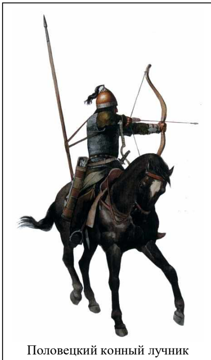
Половецкий конный лучник