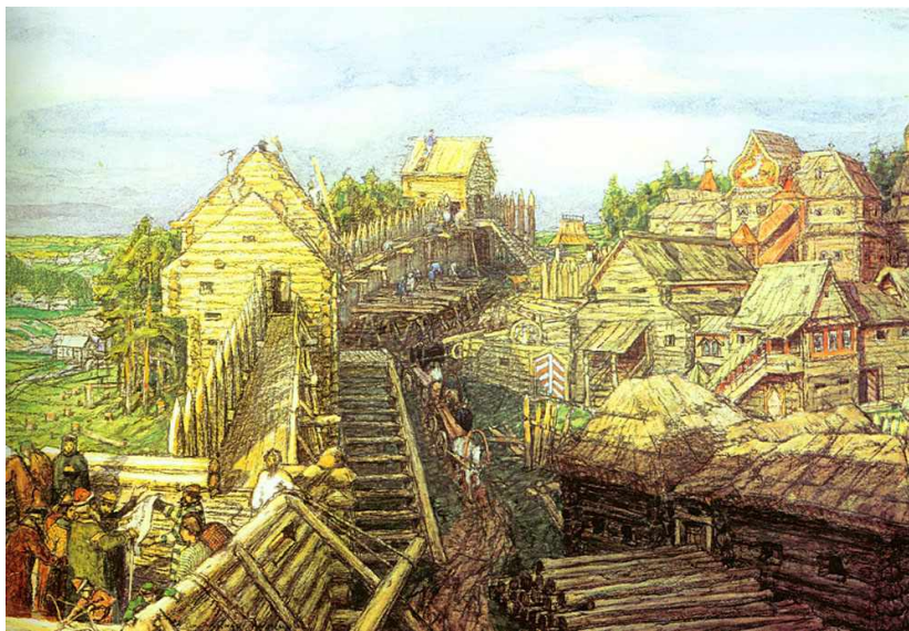
Начало строительства Москвы. Постройка деревянных стен Кремля.

КИЕВСКАЯ ЗЕМЛЯ БЫЛА РАЗОРЕНА НАБЕГАМИ ПОЛОВЦЕВ и опустела. Прекратилось движение торговых