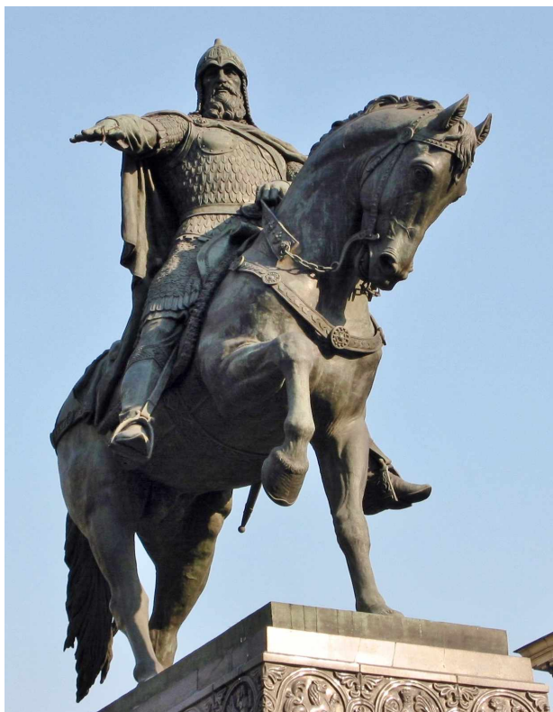
Памятник основателю Москвы – Юрию Долгорукому

от старых центров русской государственности (земли вдоль Днепра и Новгородская земля), которые были изначально заселены славянскими племенами, и только затем здесь возникла княжеская власть, русский Северо-восток во многом осваивался по инициативе княжеской власти. Наряду с Ростовом и Суздалем , старейшими городами края были Ярославль ,