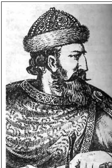
Великий князь Роман Мстиславович

В 1097 году Галицкое княжество отделилось от Киева согласно