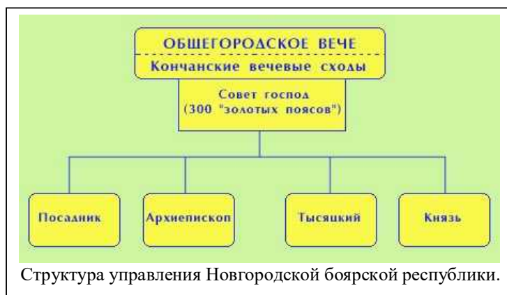
Структура управления Новгородской боярской республики.

Если князь нарушал договор, вече прогоняло его – «указывало путь».