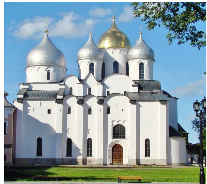
Собор Святой Софии в Великом Новгороде (1045-1050), заложённый князем Ярославом Мудрым.

Верховной властью в Новгороде было народное собрание , которое называлось ВЕЧЕ. Символом народовластия был вечевой колокол, удары которого оповещали горожан о созыве веча , на котором решались вопросы войны и мира, избирались высшие должностные лица и приглашались князя . Порой вопросы решали криком. Решение принималось в пользу той стороны, которая кричала громче. Высшим должностным лицом был посадник . Он выбирался из местных бояр.