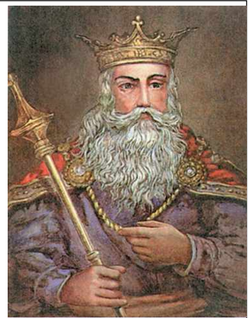
Князь Даниил Романович Галицкий

Угроза со стороны монголо-татарской Золотой Орды , о которой мы будем говорить на последующих уроках, побудили князя искать союза с