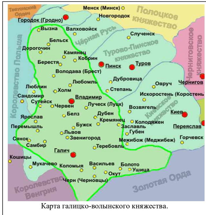
Карта галицко-волынского княжества.