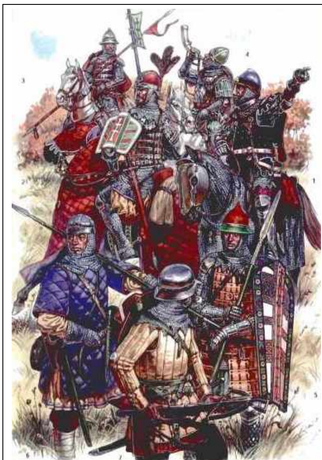
Войска Литовского княжества

В 1252 г. Миндовг заключил союзнический мир и с галицко-волынским князем Даниилом. Этот союз был скреплен браком сына князя Даниила с дочерью Миндовга. Однако он скоро распался. ТАТАРЫ, завоевавшие галицко-волынское княжество, заставили князя Даниила выступить вместе с ними против