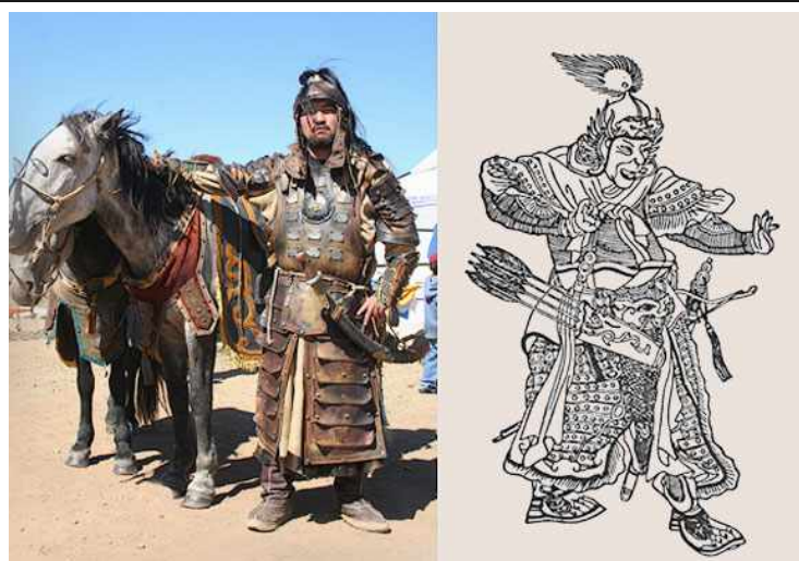
Реконструкция костюма монгольского воина XIII в. Поверх чешуйчатой кольчуги, одет жилет из толстой кожи с прикрепленными к нему металлическими пластинами.

Вся территория, занимаемая монгольскими племенами, была поделена на три части: центр, левое и правое крыло. А все воинские силы были поделены на «тьмы» (10 тысяч), «тысячи», «сотни» и «десятки». Во главе каждой «тьмы» стояли тёмники, «тысячи» – тысячники, «сотни» – сотники, а «десятки» – десятники. Такое устройство способствовало быстрому и оперативному управлению всеми военными силами. В войске была введена строжайшая дисциплина. Основной ударной силой являлась конница . Создав сильную и хорошо организованную армию, Чингисхан приступил к завоеваниям.