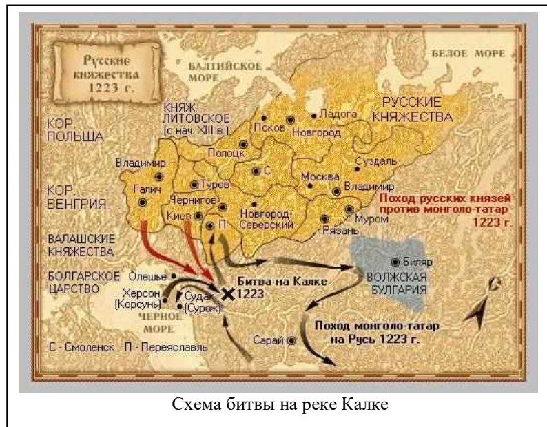
Схема битвы на реке Калке

Одержав победу, монголы не рискнули идти вглубь русских земель (они пришли сюда пока с целью разведки), а повернули на северо-восток, в Волжскую Булгарию . Ослабленные после поражений, после чего были