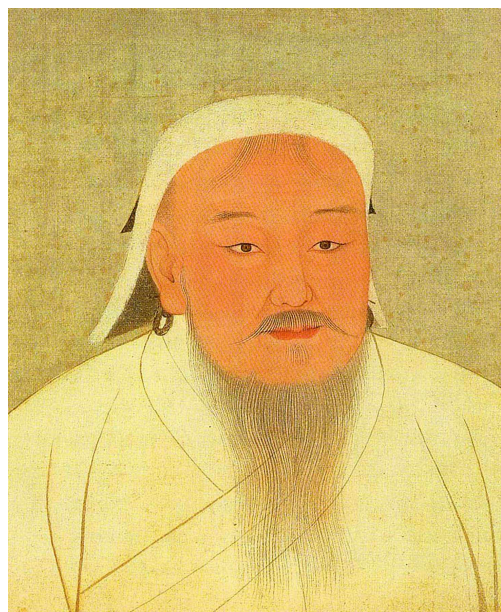
Чингисхан (1162-1227) Портрет-репродукция XIV века

В то время как на Западе создавались и укреплялись немецкие и литовские княжества, в Центральной Азии зарождалась, росла и укрепляла своё могущество Монгольская империя . Эта империя появилась в результате объединения разрозненных монгольских племён и захвата ими обширных территорий, принадлежащих другим государствам. В XII веке эти племена занимали обширную часть Центральной Азии на территории современной Монголии, Бурятии и Северного Китая.