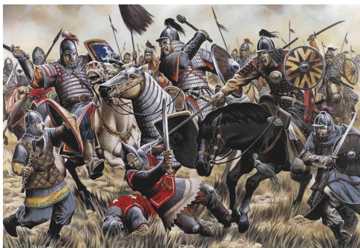
Битва на реке Калке

А если не поможете нам ныне, мы будем порублены. А на утро и вы порублены будете». На призыв половецкого князя откликнулись князья киевский, черниговский, смоленский, галицкий волынский и некоторые другие. Перед лицом опасного врага на съезде русских князей в Киеве в 1223 г. была принята попытка объединения и оказания помощи половцам. Однако не все русские земли выставили свои войска (отсутствовала дружина из Ростово-Суздальской земли), а между пятнадцатью