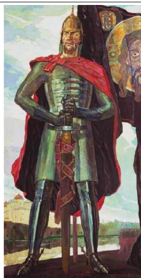
Александр Невский Худ. П.Корин

Невская битва. В июле 1240 года шведские суда вошли в устье реки Невы. Командовал ими шведский правитель Биргер . Часть войск высадились на берег, а остальные остались на кораблях. Шведы напали на Новгородские земли неожиданно. Времени на то, чтобы просить о помощи других князей у Александра Ярославовича не было, и он решил атаковать шведов незамедлительно. Перед началом битвы он усердно молился, а потом вышел к своей дружине со словами: «Нас немного, а враг силен, но