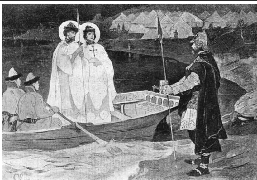
Видение Пелгусию св. князей Бориса и Глеба

Перед началом битвы произошел такой случай. На восходе солнца,