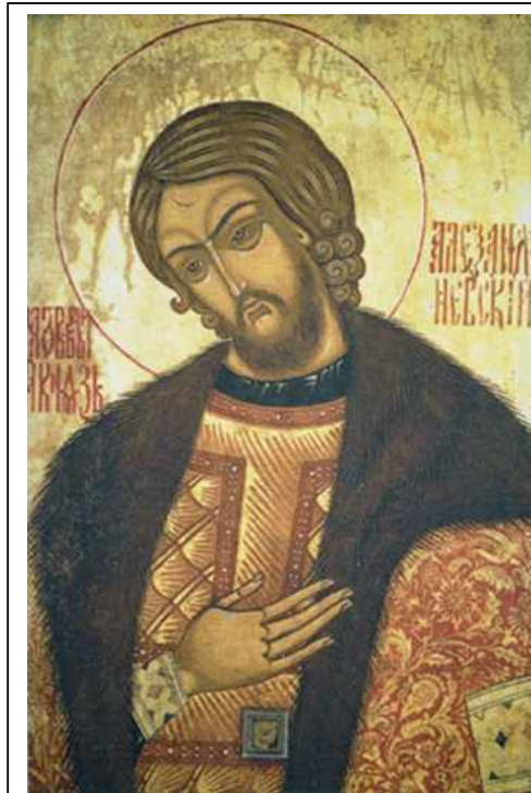
Икона св. Благоверного великого князя Александра Невского

Несмотря на то, что князю Александру Невскому всегда удавалось побеждать своих врагов, с татарами он не