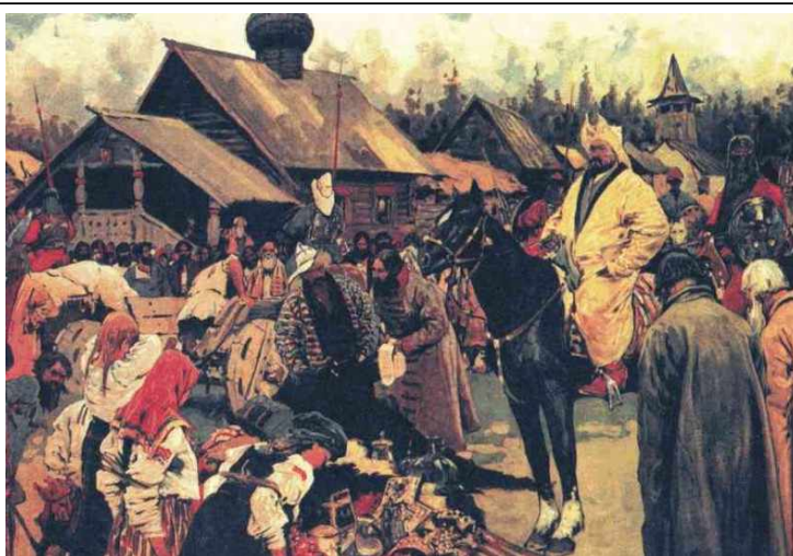
Сбор дани татарскими наместниками. Баскаки. С.В. Иванов. 1909 год

Ещё один известный историк Ключевский считал, что Орда предотвратила междоусобные войны на Руси и привела князей к осознанию необходимости единого государства. Другими словами Орда