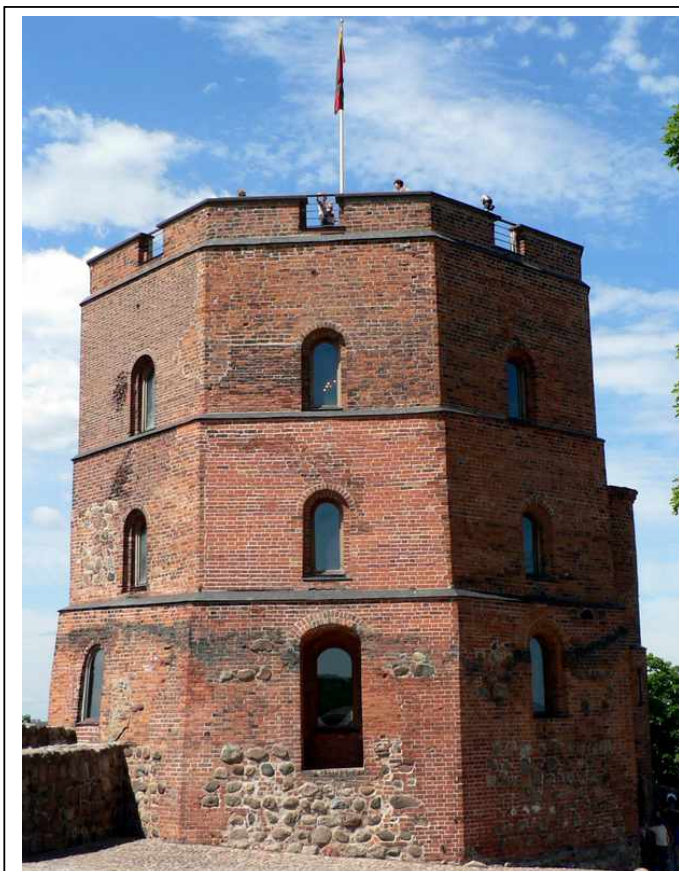
Башня Гедимина в Вильнюсе.

Большим авторитетом пользовалась православная церковь. Знать княжества состояла в основном из русских. Литовцы всё чаще принимали православную веру и всё больше попадали под влияние русской культуры.