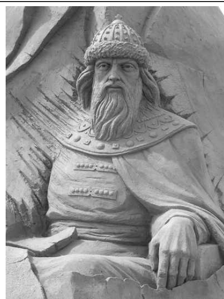
Барельеф Ивана Калиты

Он стал Великим князем Московским в 1328 году, отобрав ханский ярлык на великое княжение у тверского князя Александра. Это произошло при следующих обстоятельствах. В Твери вспыхнуло восстание против татарских баскаков, приехавших собирать дань и грабить народ. При попустительстве князя Александра народ убил баскаков. Тогда Иван Калита поскакал в Орду и стал просить хана дать ему отряд татарских воинов для усмирения непокорных. Хан выполнил его просьбу, и бунт был подавлен. В благодарность за это, Иван Калита получил от Орды право не только СОБИРАТЬ ДАНЬ С УДЕЛЬНЫХ КНЯЗЕЙ, но и судить их. Так Русь стала собираться вокруг Москвы, а последующий (после Владимиро-Суздальского) период правления Рюриковичей стал называться «МОСКОВСКИМ». Самого Ивана Калиту часто называют в истории – первым собирателем русской земли. Следует подчеркнуть, что делал он это в «симбиозе» с татарами.