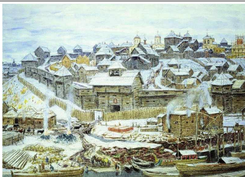
Московский Кремль при Иване Калите. Художник А.М.Васнецов.

впадает в реку Москву . Сама река Москва впадает в реку Оку, а та в свою очередь, впадает в Волгу, которая течёт через всю Россию и впадает в Каспийское море . Таким образом, Москва оказалась на торговом пути между