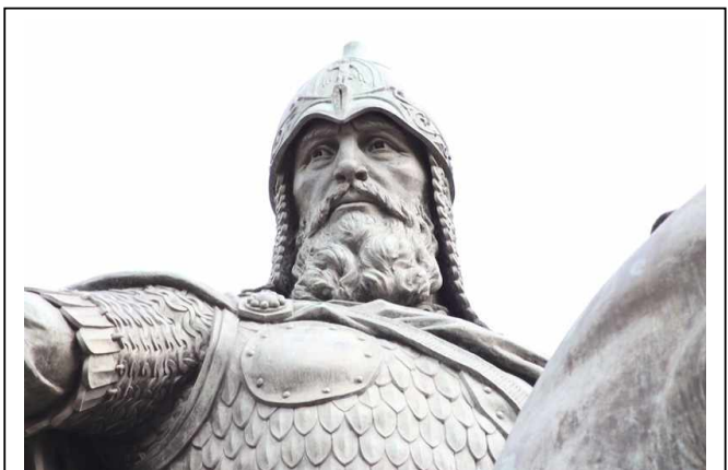
Скульптура Юрия Долгорукого

Причины возвышения Московского княжества. Первая причина возвышения Москвы и усиления Московских князей заключалась в особенно выгодном географическом положении города. Москва была построена в том месте, где небольшая река Неглинка