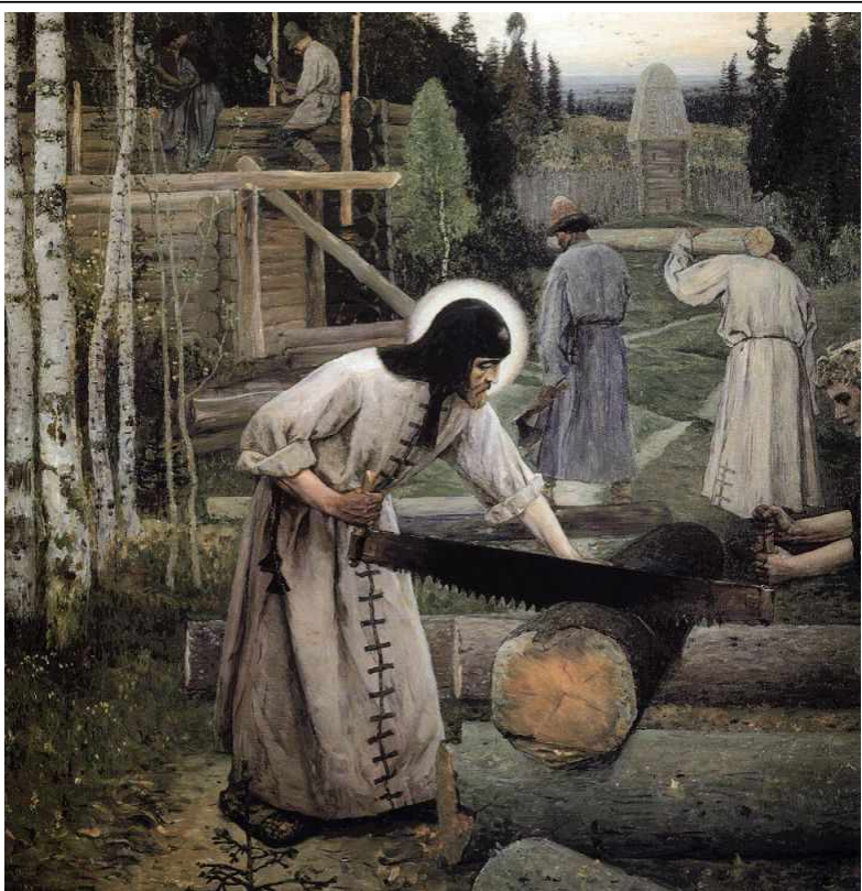
Труды Сергия Радонежского. Худ. М.Нестеров

и пост составляли жизнь Сергия. Со временем