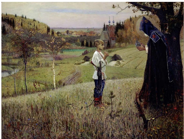
Встреча Варфоломея со старцем. Худ. М.Нестеров

Однажды по заданию отца он отправился в поле искать лошадей. Во время поисков он вышел на поляну и увидел под дубом старца-схимника, благообразного и подобного Ангелу, который стоял в поле под дубом и усердно со слезами молился. Увидев его, Варфоломей сначала смиренно поклонился, затем подошёл и стал вблизи, ожидая, когда