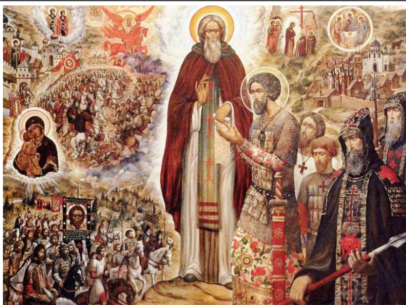
Св. Сергий Радонежский благословляет Дмитрия Донского. Художник С.Симаков

Численность татарской рати достигала 150 тысяч воинов. В неё вошли не только ордынские воины, но и полки, сформированные на территориях