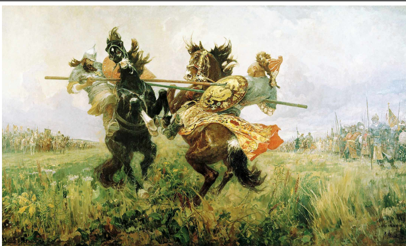
Схватка Челубея и Пересвета. Художник М.Авилов

Бой начался поединком двух богатырей – ордынского ЧЕЛУБЕЯ и русского ПЕРЕСВЕТА.