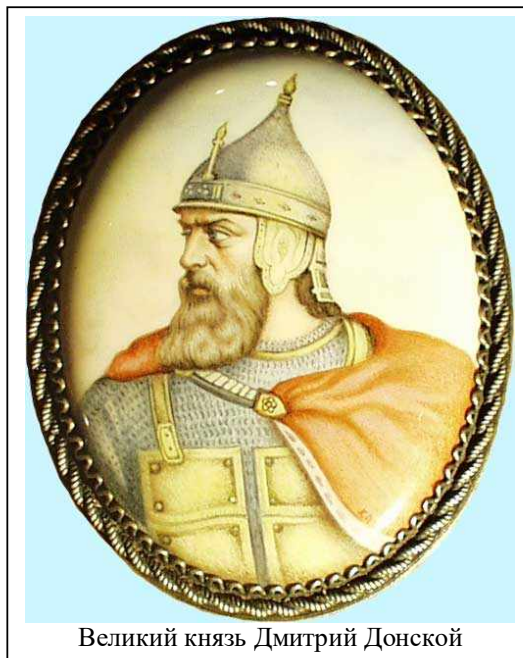
Великий князь Дмитрий Донской

В 1369 году Дмитрий уже сам пошел войной на Ольгерда и разгромил союзные ему Смоленское и Брянское княжества. В ходе этой войны тверской князь Михаил несколько раз получал ярлык на великое княжение, но, в конечном счете, верх одержал Дмитрий. Его успех в значительно мере стал возможен, благодаря мудрой поддержке митрополита Алексия. Владыка много потрудился, чтобы объединить под