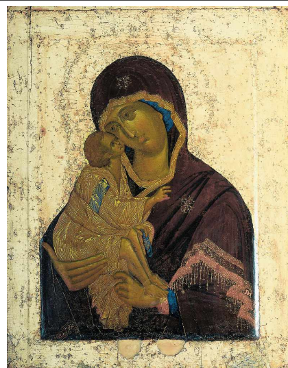
Донская икона Божией Матери. Феофан Грек, XIV в.

Накануне битвы князь Дмитрий посетил Троице-Сергиев монастырь. Он поехал к преподобному СЕРГИЮ РАДОНЕЖСКОМУ, чтобы получить у него благословение на решительный бой. Преподобный Сергей своим прозорливым умом понимал, что пришло время сразиться с татарами. Он благословил Дмитрия на сражение и передал ему икону Божией Матери, которая потом получила название Донской . Написана она была в XIV веке знаменитым иконописцем Феофаном Греком . Благословляя, преподобный Сергей сказал: «Иди князь против безбожников, и Бог правды дарует тебе победу». При этом преподобный послал вместе князем двух воевод-схимников от братии. Их звали ПЕРЕСВЕТ и ОСЛЯБЯ.