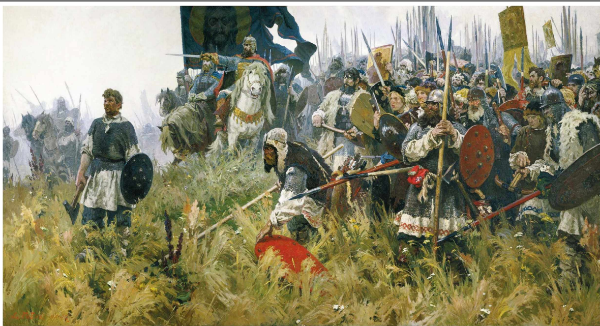
Утро на Куликовом поле. Художник А.П.Бубнов

когда их силы уже были на исходе, лучший полк под начальством воеводы Боброка , сидевший в засаде , ударил по татарам. Не ожидавшие такого удара, татары побежали, бросая оружие. Русские преследовали татар несколько десятков вёрст.