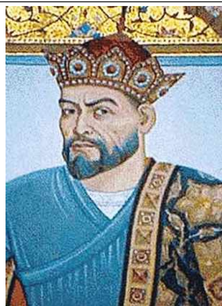
Хан Тимур (Тамерлан)

Преодолеть усобицу на некоторое время удалось ордынскому мурзе ЕДИГЕЮ. Осенью 1408 года он внезапно и скрытно вторгся в Русскую землю и осадил Москву. Однако взять её ему не удалось. Видя неприступность