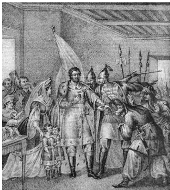
Князья и бояре помогают Василию Тёмному возвратить великокняжеский престол, 1446 год

Один из таких изгнанников хан Улу-Мухаммед, разорив русские земли на Оке, пошёл на Волгу и устроил там себе город Казань на реке Казанке , близ впадения её в Волгу . Основав там особое Казанское царство , он оттуда стал громить Русь, доходя в своих набегах до самой Москвы.