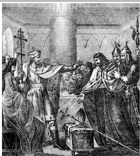
Василий II отвергает унию с католической церковью

В 1445 году великий князь Василий Васильевич необдуманно выступил