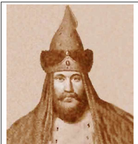
Василий I Дмитриевич