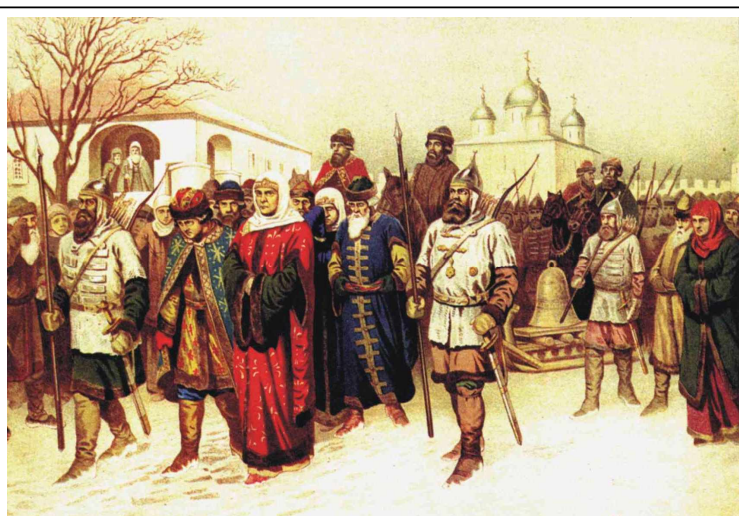
Изгнание Марфы Посадницы из Новгорода. Худ. А.Кившенко