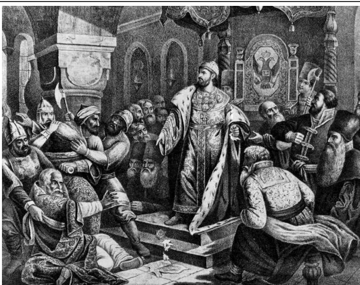
Иван III разрывает ханскую грамоту с требованием дани. Худ. Н. Шустов.

Стояние на Угре. Освобождение от власти Орды. В 1473 году, воспользовавшись борьбой среди ордынских ханов, Иван III перестал