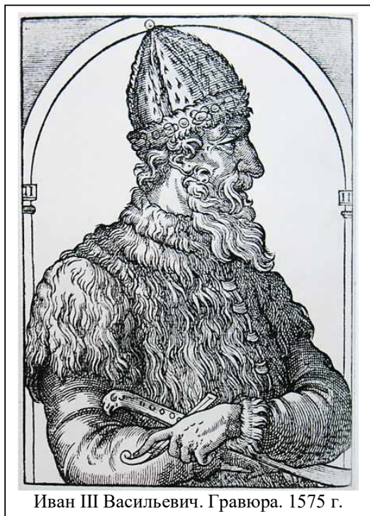
Иван III Васильевич. Гравюра. 1575 г.

Великий князь ИВАН III ВАСИЛЬЕВИЧ, СЫН Великого князя Московского Василия II Васильевича Тёмного , родился в Москве 22 января 1440 года. Он приходился правнуком Дмитрию Донскому .