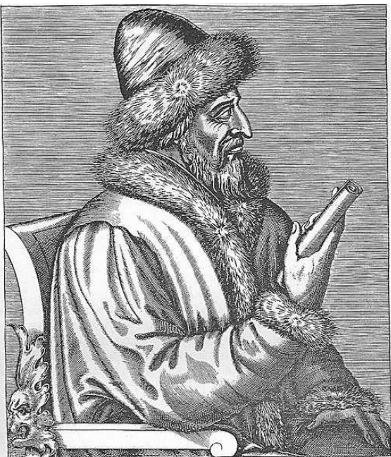
Василий III Иванович. Французская гравюра А.Тевета

Василий III был вторым сыном Ивана III и старшим сыном его второй жены – СОФИИ ПАЛЕОЛОГ. Первым и самым старшим сыном от первого брака был Иван Молодой . Иван III, заботясь об укреплении единой власти в Московском государстве, ещё при жизни объявил его своим соправителем. Но в 1490 году Иван Молодой умирает в возрасте 32 лет, оставив после себя единственного ребенка Дмитрия .