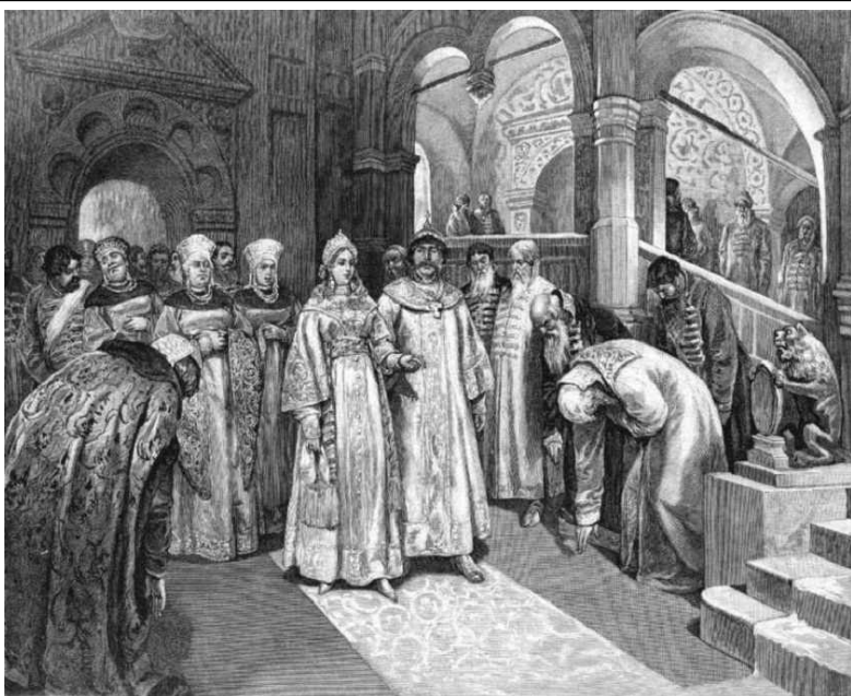
Василий III вводит во дворец свою невесту Елену Глинскую.

Власть Московских князей стала самодержавной . Иностранные послы