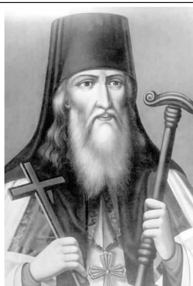
Протопоп Сильвестр – член Избранной рады, советник царя Иоанна IV.

Свое царство он завещал своему единственному сыну-младенцу Димитрию и хотел, чтобы бояре немедленно ему присягнули . Но опасаясь, что за него будет править ненавистная боярам семья Захарьиных, они начали смуту. Против его сына высказались даже некоторые члены Избранной рады, которые желали, чтобы