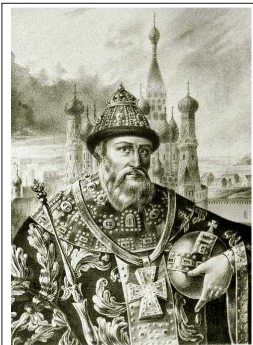
Иван Грозный на фоне Храма Василия Блаженного