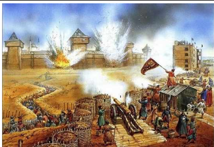
Взятие Казани, 1552 г.

Летом 1552 года, нарушив мирный договор, Иван IV во главе 150-тысячного русского войска подступил к городу и осадил его. После упорной обороны Казань была взята приступом. Решительный вклад в победу