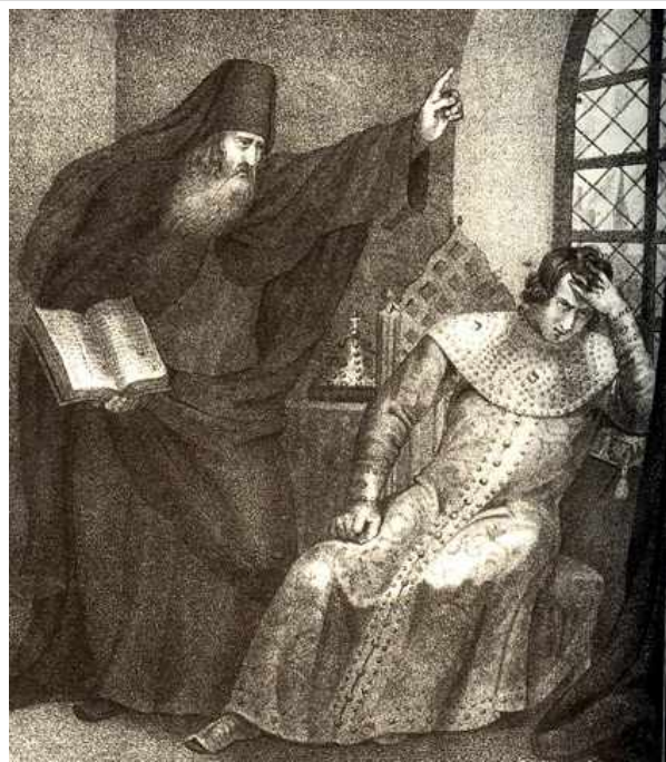
Сильвестр убеждает царя изменить свой характер.

Внутренняя политика в первый период правления Ивана IV. В 1547 году в Москве случился страшный пожар, испепеливший Кремль и значительную часть города. Один из священников митрополита Макария –