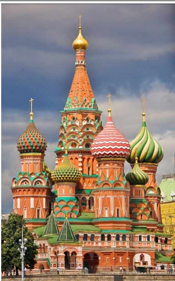
Собор Покрова Божией Матери в Москве, известный как Храма Василия Блаженного, был построен в память о взятии Казани.

Мы уже говорили о том, что астраханские и казанские татары не давали покоя московскому царю.