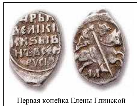
Первая копейка Елены Глинской

Достигнув 16 лет, он объявил митрополиту и