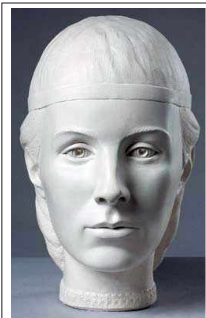
Елена Глинская – реконструкция

За менее чем пятилетний период своего правления Елена Глинская смогла провести ряд важных для укрепления власти реформ.