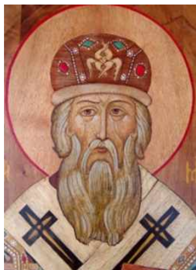
Святитель Макарий, Митрополит Московский и всея Руси

почтения, как великому князю. Мальчик озлоблялся и, не видя доброго воспитания, сам поддавался дурным наклонностям. Он начал проявлять жестокость в своих играх, мучая и калеча животных и людей. Вместе со злобой в Иване развилось двуличие и притворство . Не смея ещё прямо разогнать ненавистных ему бояр, он скрывал свои чувства и таким образом становился двоедушным .