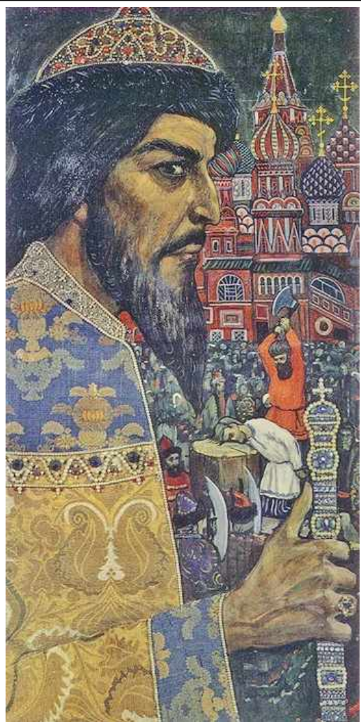
Иван Грозный. Худ. Илья Глазунов

царю мелкие помещики-опричники. В первую очередь, с прежних земель выселялись потомки удельных (родовитых) князей. Их переселяли на окраины государства, где эти люди не представляли опасности для царской власти. Такое изгнание старой знати царь вёл почти 20 лет, до самой своей смерти, забрав в опричнину половину всего государства. Остальная половина управлялась Боярской Думой и называлась «земщиной».