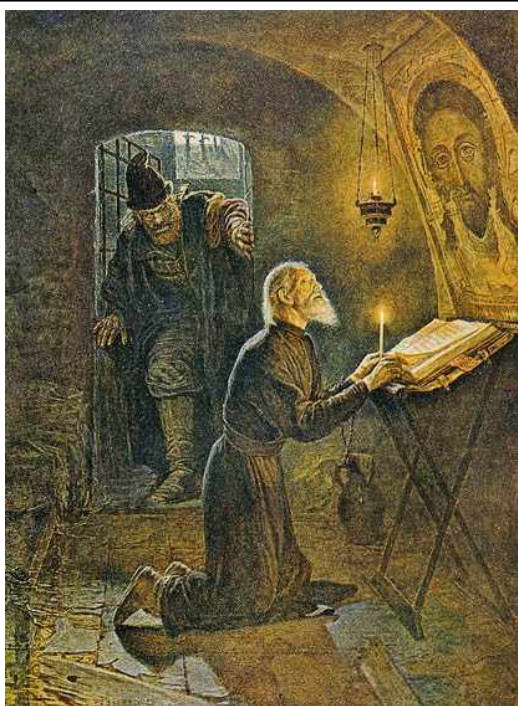
Митрополит Филипп и Малюта Скуратов. Худ. А. Новосколыцев

опричнины. Но вскоре все просители были казнены.