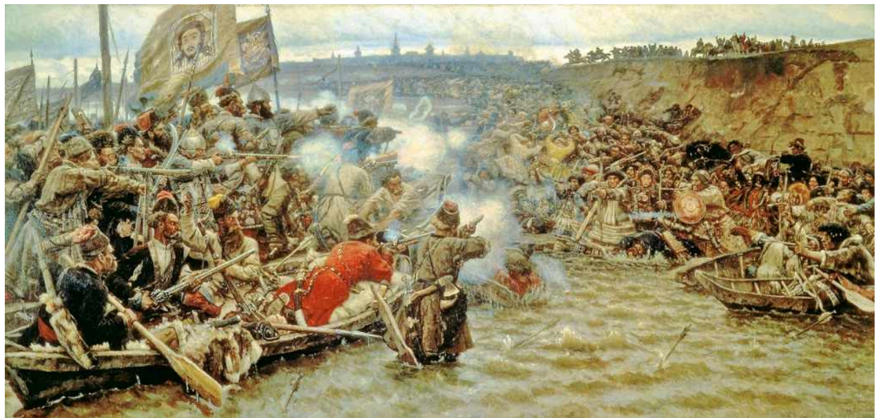
Покорение Сибири Ермаком. Худ. В.Суриков

том, что своими действиями они разъярили казанского хана. Но потом, получив известия об успехах в Сибири и богатые дары, царь оказал казакам поддержку. Но это смогло удержать власть над Сибирским