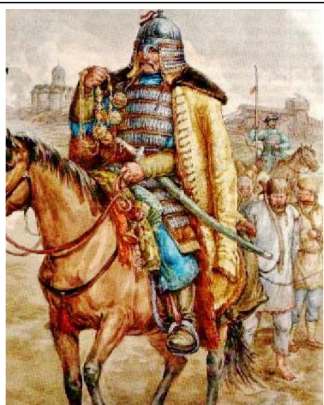
Ханский воин уводит в плен русских

Неудачные попытки взять Астрахань не утомили хана Девлет-Гирея. В 1571 году, ранее разорив Рязань (1564), он решает идти на Москву, предварительно заручившись поддержкой Османской империи и согласованием с Речью Посполитой . Ему удалось обмануть русские сторожевые дозоры и внезапно подойти к Москве. Иван Грозный, опасаясь