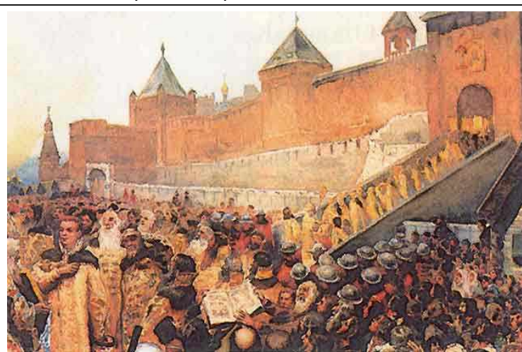
Вступление войск Лжедмитрия I в Москву. Худ. Лебедев

В управлении государством Борис продолжал делать то, что делал при царе Федоре: всеми мерами стремился к восстановлению народного благосостояния, потрясенного в эпоху Грозного. Он уклонялся от внешних столкновений, не желая втягивать государство в новые войны. Он заботился об укреплении правосудия и справедливости и желал оградить мирное население от насильников. Однако его добрым намерениям помешал ряд непредвиденных обстоятельств.