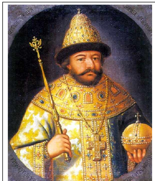
Царь Борис Годунов

Воцарение Бориса Фёдоровича Годунова. Царь Фёдор умер в 1598 году, не оставив потомства. По его завещанию управлять государством после него должна была его жена – царица Ирина . Но она не пожелала быть на престоле и ушла в монастырь, где постриглась в монахини. Со смертью Царя Фёдора в Москве прекратилась мужская линия Ивана Калиты – ДИНАСТИИ РЮРИКОВИЧЕЙ. Москвичам надлежало избрать себе нового государя.