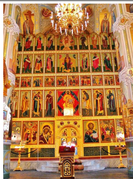
Иконостас Благовещенского собора Московского кремля.

Иконостасы как самобытное культурное явление появились в русских церквях в конце XIV века (византийская культура не знала таких больших иконостасов). Русский иконостас представлял собой часть внутреннего убранства храма. Иконы, поставленные в несколько рядов, образовывали высокую стену, отделяющую алтарь от остальной части помещения. Иконы располагались в строгом порядке. В нижнем ряду помещалась икона святого или праздника, в честь которого возведена данная церковь. Далее следовал ряд икон, в центре которых изображался Христос, а по обеим сторонам в молитвенных позах Богоматерь, Иоанн