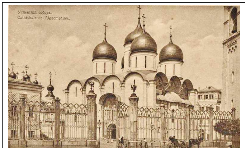
Успенский собор Московского кремля. Фото 1916 г.

Итальянцы ввели в конце XV века новый строительный материал – кирпич. Итальянский