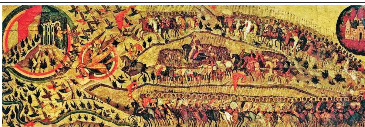
Икона «Церковь воинствующая» из Успенского собора Московского Кремля. 1550-е годы.

Крупнейшим представителем московской школы живописи конца XV –