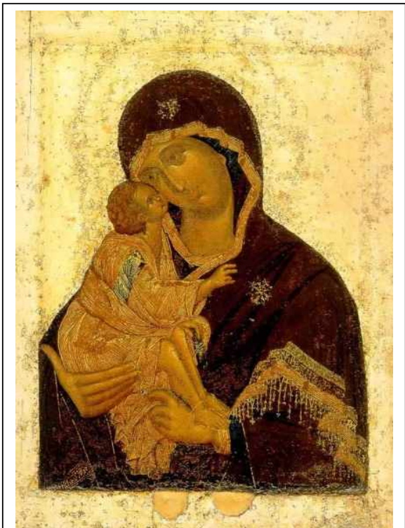
Феофан Грек. Икона Донской Богоматери.

Русская живопись XV-XVI веков. На предыдущих уроках мы уже упоминали имя ФЕОФАНА ГРЕКА, который был крупнейшим художником-иконописцем конца XIV – начала XV века. Он приехал из Византии на Русь в 70-х годах XIV века и работал сначала в Новгороде, а затем в Москве.