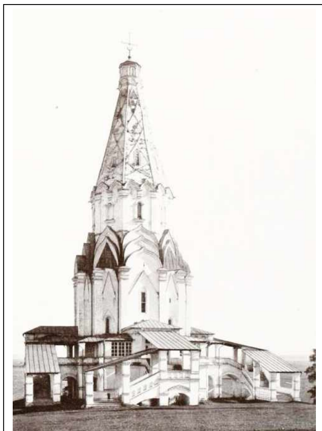
Храм Вознесения в селе Коломенском.

Кирпич не полностью вытеснил белый камень, из которого по-прежнему выкладывали: фундаменты и вырезали детали для украшений фасадов зданий. Марко Руффо и Пиетро Антонио Солари построили в