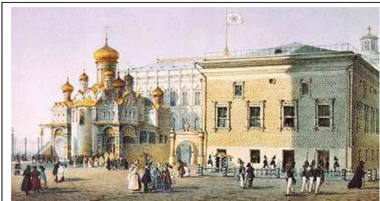
Грановитая палата и Благовещенский Собор в середине XIX в.

Наиболее величественной постройкой, возвышающейся в самом