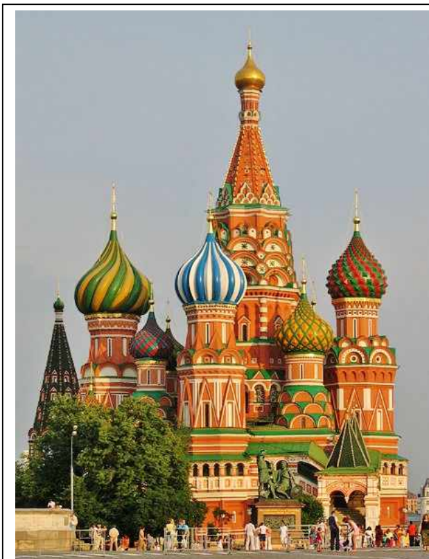
Москва. Покровский собор. Храм Василия Блаженного. 1555-1561

Но особенно ярко художественные достоинства архитектуры проявились в церковных постройках. Каменное столичное зодчество впитывает в себя традиции русского народного деревянного зодчества.