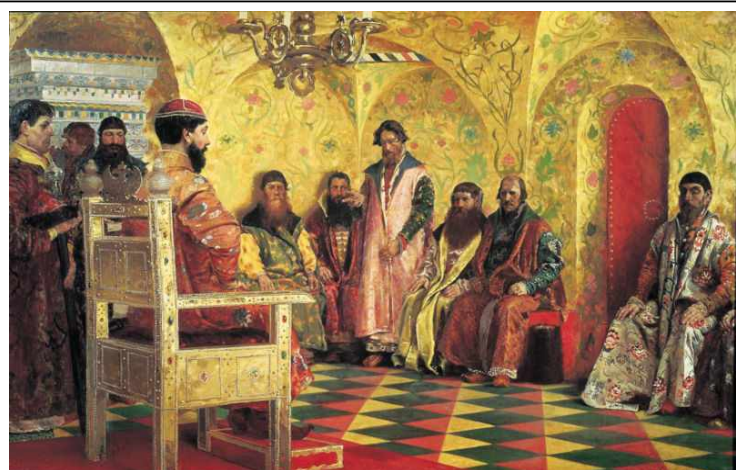
Михаил Фёдорович на собрании боярской Думы

Спустя несколько дней царь со свитой выехал из Костромы и торжественно отправился в Москву. Миропомазание и венчание на царство