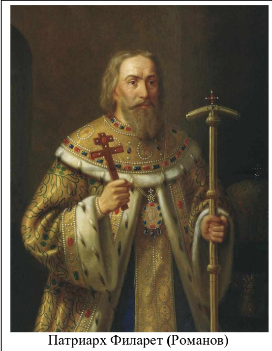
Патриарх Филарет (Романов)

Михаил Романов был внучатым племянником Анастасии Романовы – первой жены Иоанна Грозного , внуком её брата Никиты .