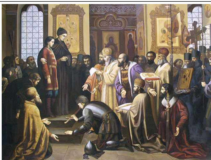
Послы Земского Собора умоляют Михаила и инокиню Марфу стать царем.

Венчание на престол. 13 марта 1613 года послы Собора прибыли в Ипатьевский монастырь, чтобы сообщить 16-ти летнему Михаилу о его избрании на престол (отец царя – патриарх Филарет в это время находился в польском плену). Каково же было изумление послов, когда ни Михаил,