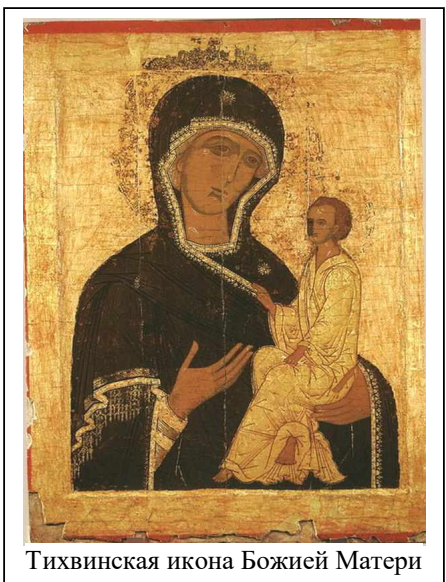
Тихвинская икона Божией Матери

В следующем 1618 г. в селе Деулино (близ Троице-Сергиева монастыря) было заключено ДЕУЛИНСКОЕ ПЕРЕМИРИЕ с Польшей. Сильные войска королевича Польского ВЛАДИСЛАВА в это время стояли у стен Москвы. Намерениям Владислава занять Москву, как и в годы Смуты, препятствовали храбрые князья: Пожарский и Трубецкой . Они и другие полководцы царя Михаила заставили отступить Владислава и вынудили его