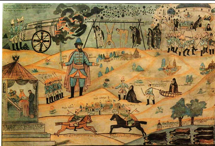
Воевода Мещеринов подавляет Соловецкое восстание.

непростым. Он представлял собой хорошо укрепленный форпост, предназначенный для защиты от шведов. На протяжении восьми лет предпринимались попытки захвата монастыря. Наконец, 22 января 1676 года, в результате предательства одного из насельников, царским стрельцам удалось проникнуть внутрь через потайной лаз. Произошел жестокий бой. Многие погибли в этом бою, многие были казнены, многие