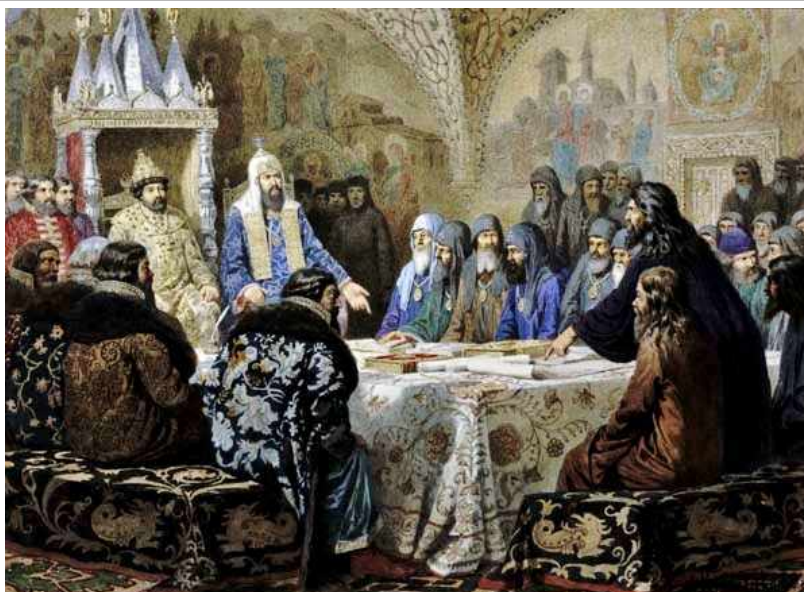
Церковный Собор 1654 года Патриарх Никон представляет новые богослужебные тексты

Церковная реформа (1650-1660). Став Патриархом, Никон счел своим первым главным делом – исправление богослужебных книг , так как в них появилось много расхождений с греческими (византийскими) книгами