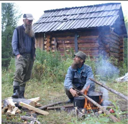
Современные староверы в верховьях Енисея. Сибирь, Тува – август, 2014 г.

Церковный раскол. Таким образом, в результате церковной реформы произошел РАСКОЛ Русской Православной церкви. Тех людей, которые отделились от церкви и продолжали молиться по старым книгам, стали называть «РАСКОЛЬНИКАМИ» или «СТАРОВЕРАМИ». Большой Московский Собор 1667 г. окончательно утвердил все исправления в церковных книгах и обрядах. На тех, кто не пожелает подчиниться решениям собора, была заранее наложена анафема . Непокорных было предписано отлучать от церкви. Несмотря на это, сторонники старой веры сохранились на долгие годы и существуют в наше время. Прещения Собора (1667) были со временем отменены, а вера старообрядцев была признана спасительной † .