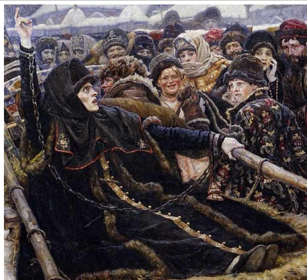
Боярыня Морозова. Фрагмент картины Василия Сурикова (1887).

Боярыня Морозова Феодосия Прокопьевна, в девичестве Соковнина, была женой брата боярина Морозова, воспитателя царя Алексея Михайловича. Овдовев, она тайно постриглась в монахини под именем Феодоры. За принадлежность к старой вере, "противление" царю и патриарху она была подвергнута опале, её огромное состояние было конфисковано. Зимой 1673 вместе с сестрой – княгиней Урусовой она была подвергнута пыткам, а затем отправлена в Боровск, где её уморили голодом в земляной тюрьме.