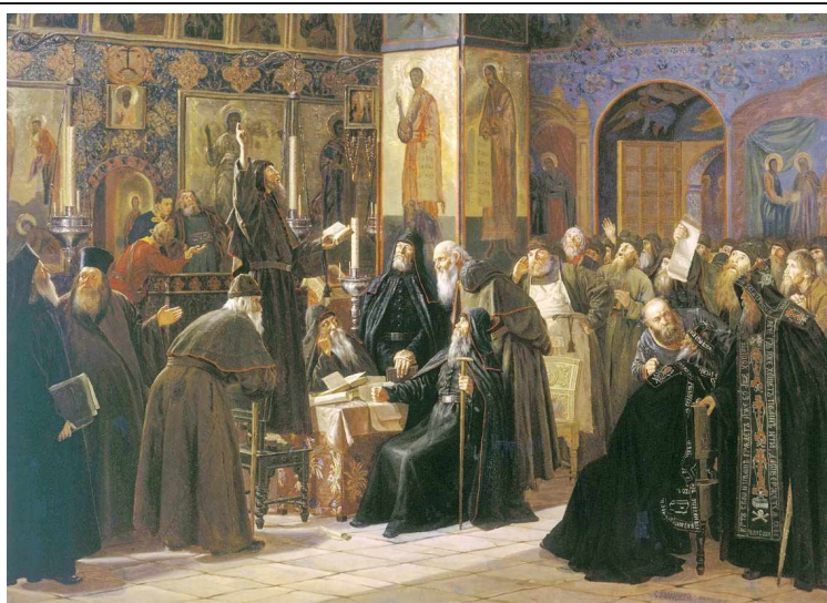
Черный собор. Восстание Соловецкого монастыря против новопечатных книг.

Патриарх Никон предвидел, что церковные реформы могут вызвать недовольство привыкшего к старым традициям народа, так как многие русские люди воспринимали реформы как иностранное ( греческое ) вмешательство. К тому же он осознавал, что идёт наперекор Стоглавому