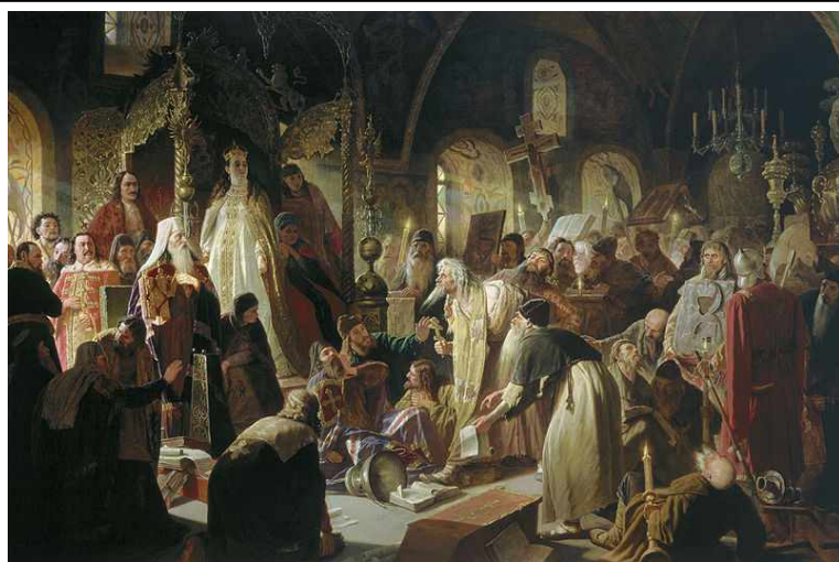
«Прения о вере» Никиты Пустосвята в Грановитой палате в присутствии Патриарха Иоакима и царевны Софьи (1682 г.)

Протопоп Аввакум был предан анафеме и отправлен в ссылку, но вскоре милостью царя Алексея был возвращен в Москву. Его уговаривали раскаяться, но он твердо стоял на своём. Тогда его