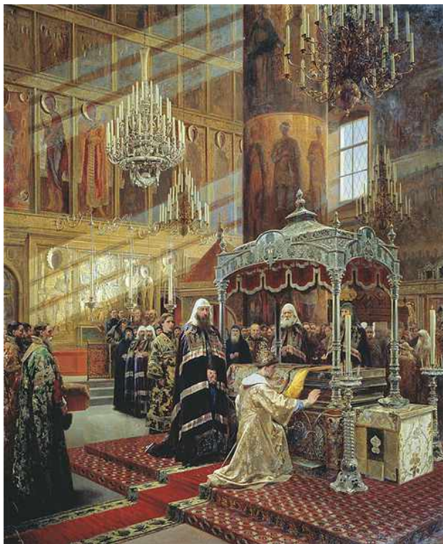
Царь Алексей Михайлович и Патриарх Никон перед гробницей святителя Филиппа

умирают его родители, а затем и все его дети. Для Никиты это стало знаком того, что мирская жизнь – не для него. Он убеждает свою жену уйти в монастырь, а сам принимает монашеский постриг с именем Никон . Способности и дарования монаха были очень скоро замечены, и его назначают игуменом (настоятелем) монастыря. По прошествии некоторого времени, он отправился в Москву, чтобы по традиции того времени явиться на поклон молодому царю Алексею Михайловичу . Необыкновенный ум и высочайшие дарования Никона были сразу же замечены царем. Царь велел Никону остаться в Москве, где он был назначен архимандритом Новоспасского монастыря .