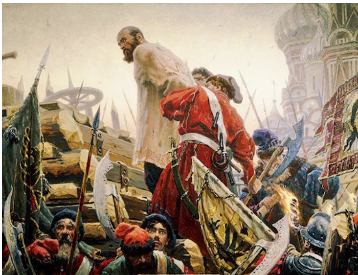
Казнь Степана Разина на Болотной площади в 1671 г.

Волге. Но под Симбирском Разина поджидала неудача. 3 октября 1670 г. 60-тысячное правительственное войско под командованием воеводы Юрия Бяргинского нанесло разинцам сокрушительное поражение. Разин был ранен и бежал на Дон. Он рассчитывал вновь собрать своих сторонников. Однако домовитые казаки, понимая, что действия Разина могут навлечь царский гнев на все казачество, схватили его и выдали правительственным воеводам.