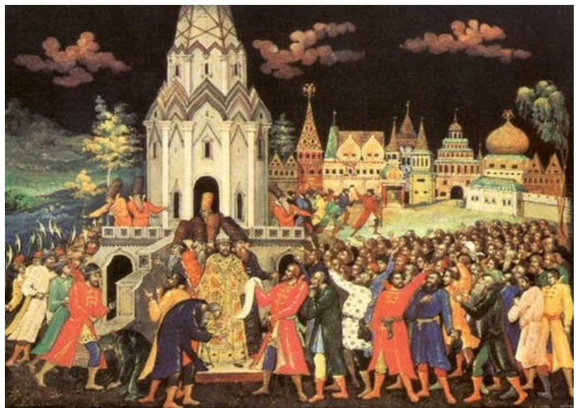
Медный бунт 1662 года в Москве.

В 1662 г. в Москве вновь произошло крупное восстание, которое вошло в историю как " МЕДНЫЙ БУНТ ". Он был вызван введением в оборот медных денег, которые были приравнены к серебряным. Медные деньги были выпущены из-за нехватки серебряных, чтобы пополнить казну, опустошенную тяжелой длительной войной с Польшей и Швецией. При этом налоги собирались