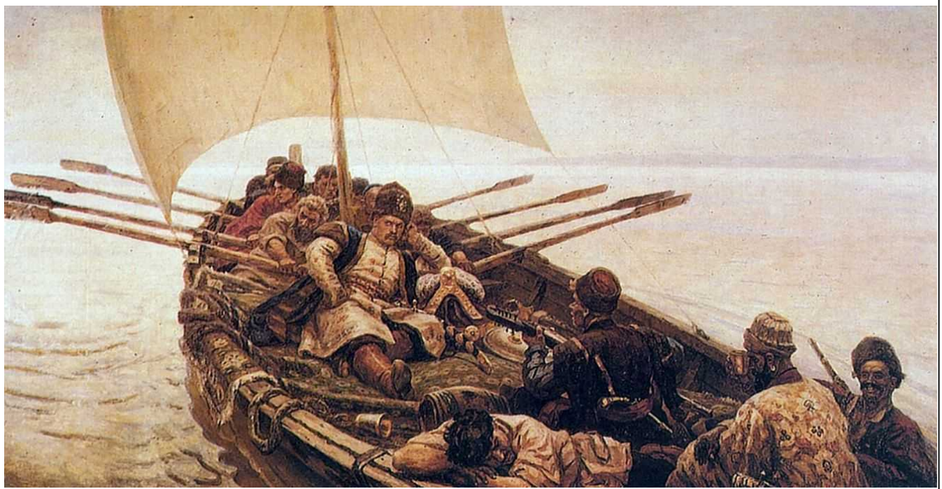
Степан Разин. Художник В.Суриков

находятся царевич Алексей Алексеевич (на самом деле уже умерший) и патриарх Никон . Таким образом, ему удалось вовлечь в свое движение не только казаков, но русских крестьян и народы Поволжья: мордву, татар, чувшей и др.