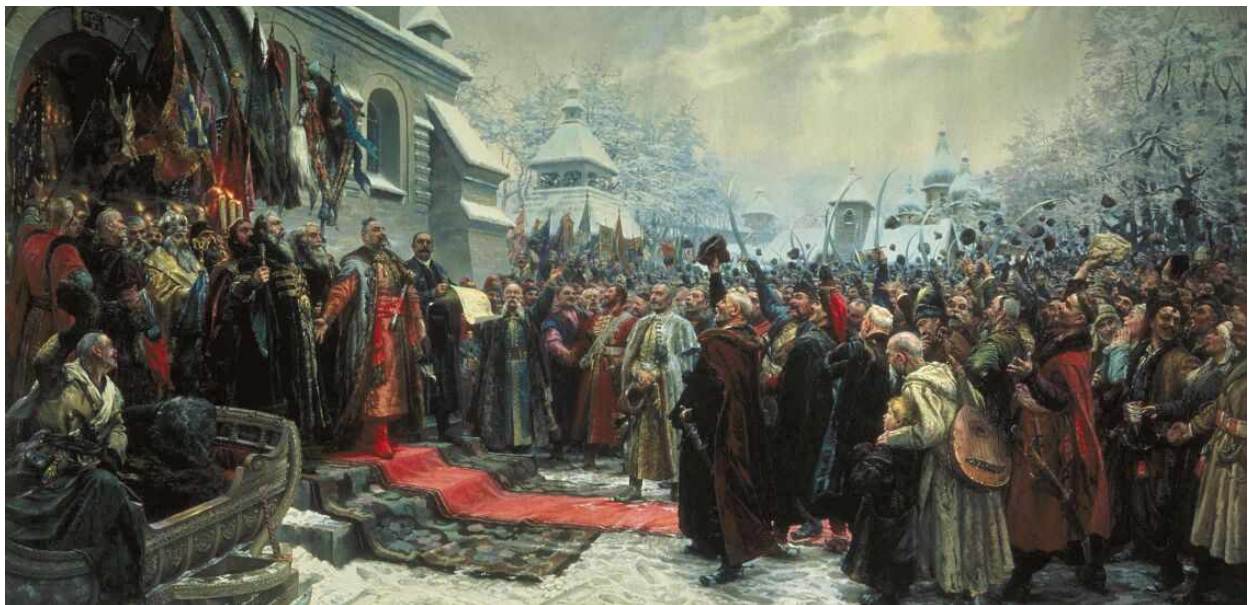
Московский посол боярин Василий Бутурлин и гетман Богдан Хмельницкий на казачьей Раде в Переяславле в 1654 г.

Вопрос был трудный: Москву страшила война с Польшей. Для его решения был созван 3-й за время царствования Алексея Михайловича