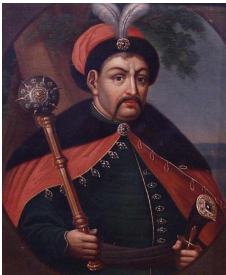
Богдан Хмельницкий. Художник С.Землюков

отчасти вели оседлое полевое хозяйство, отчасти же охотились и «казаковали» в степях, сражаясь с татарами или занимаясь грабежом. Появление среди них польской шляхты, желавшей обратить их в крепостных «хлопов» наравне с крестьянами, было для них неприемлемо. Казаки уходили всё дальше в степи, недоступные польским властям. На островах нижнего Днепра, за Днепровскими порогами, они строили себе укрепленные засеками городки, получившие название «ЗАПОРОВСКИЕ СЕЧИ». Чем сильнее становилось в государстве гонение на православную веру и угнетение крестьян шляхтою, тем больше народа бежало на Украину в степь и тем больше становилось там вольного и беспокойного казачества.