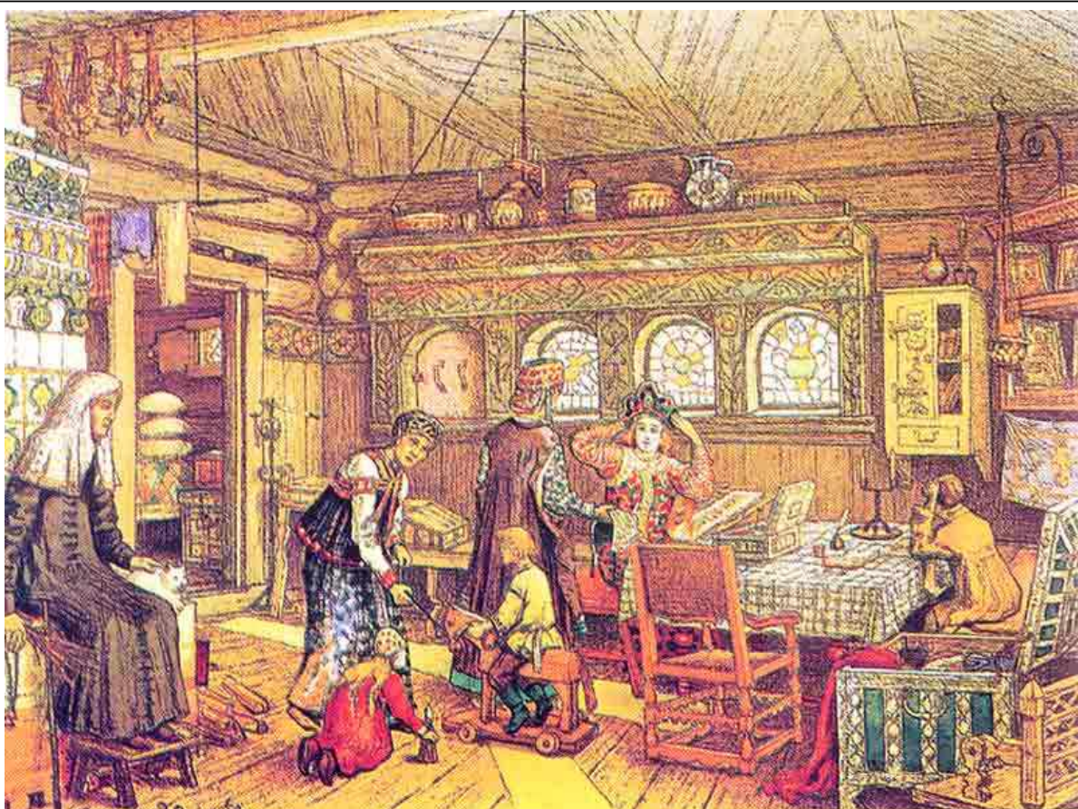
В горнице XVII века

до крестьянина ложились отдыхать. Семейный быт был очень строг: мужу как главе семьи все должны были подчиняться. Семейный уклад того времени был изложен в «ДОМОСТРОЕ» – книге написанной в XVI веке, которая включала правила, советы и наставления по всем направлениям