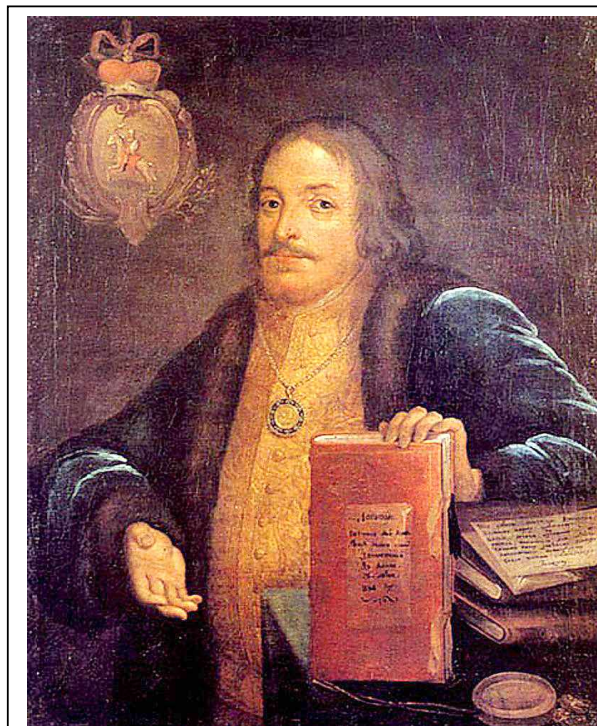
Князь Василий Васильевич Голицын

Москва не только присматривалась к обычаям западноевропейской жизни, но в XVII в. начала интересоваться и западной литературой. В Посольском приказе, самом образованном учреждении того времени, переводили вместе с политическими известиями из западных газет для государя и целые книги, по большей части руководства прикладных наук.