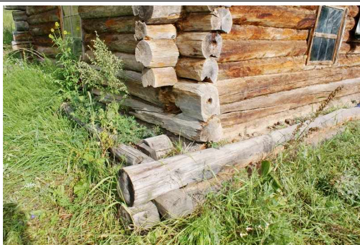
Завалинка с земляной насыпью.

или крепилась на деревянных столбах – обрубках. По периметру изба обносилась (заваливалась) земляной насыпью, которую с боков