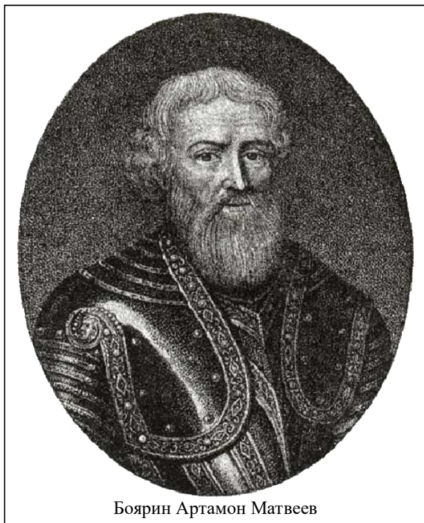
Боярин Артамон Матвеев

Особо следует остановиться на любимце и друге царя Алексея –