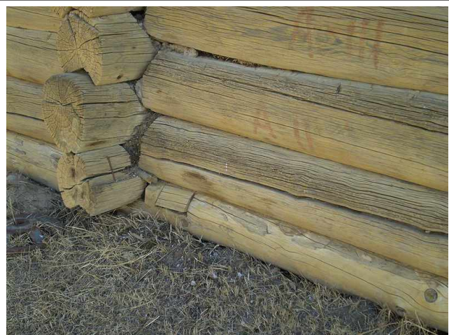
Бревна избы, уложенные в венец

Избы строились из больших бревен. По углам избы бревна укладывались в венец , а вдоль бревна прорубалась ложбина для более плотного прилегания одного бревна к другому. Для утепления, между бревен прокладывали мох. Нижняя часть избы, как правило, устанавливалась прямо на землю