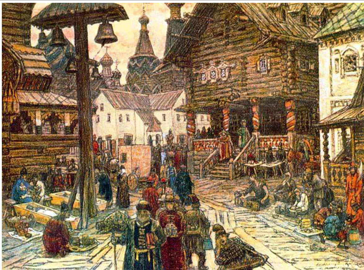
Дом богатого боярина на Каменном мосту в Москве. Художник А.М.Васнецов

иконы (образа), а под ними стоял стол. Входящий в избу всегда в первую очередь поворачивался лицом к образам, крестился и кланялся, а только потом здоровался с хозяином. Зимой в избе, для тепла, вместе с людьми жили коровы, гуси и куры. День начинался очень рано с семейной молитвы. Многие ходили к обедне . Обедали днём. После обеда все от царя