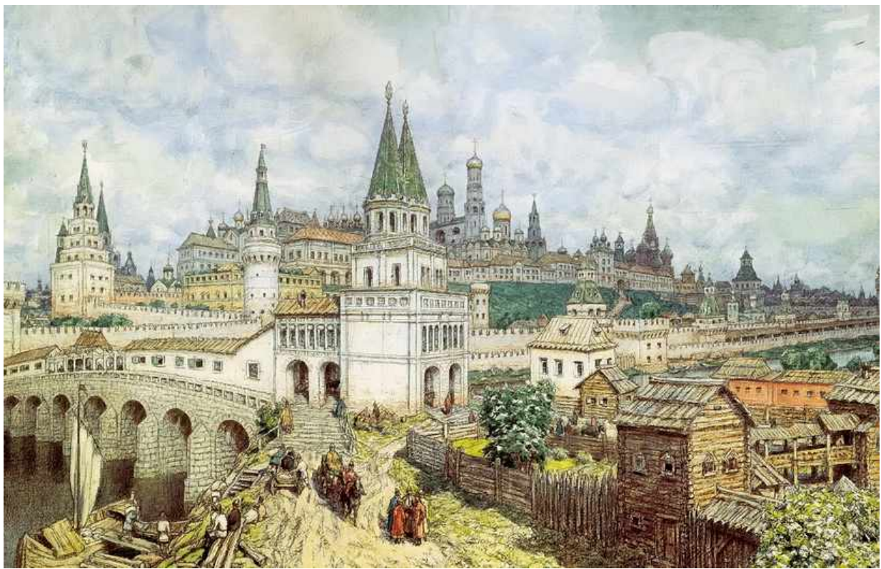
Кремль и каменный мост в XVII в. Художник А.М.Васнецов

При царе Алексее Михайловиче почти все дома в Москве были деревянными, и только в центре города стоял каменный КРЕМЛЬ. Стены Московского кремля были построены из белого известняка (доломита) ещё при Великом князе Дмитрие Донском (1367), поэтому Москву в те годы часто называли «белокаменной». Подъезжающие к Москве могли издали видеть белые церкви и их золотые купола.