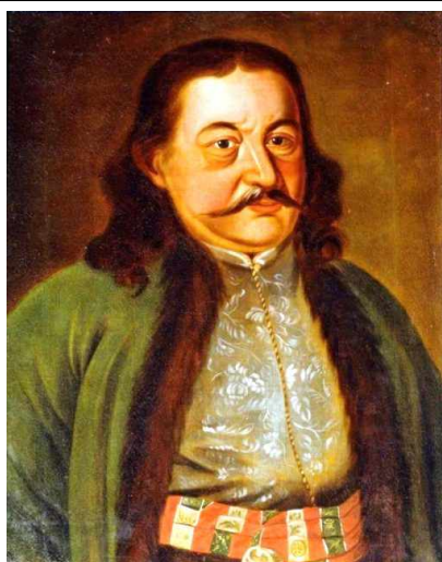
Князь Фёдор Ромодановский

Обучать Петра грамоте по старорусскому обычаю начали с пяти лет. Первым его наставником и учителем стал смиренный дьяк НИКИТА ЗОТОВ, которого ему лично подобрал его старший брат и крестник – царь Фёдор Алексеевич . Однако в десятилетнем возрасте регулярное образование Петра было прервано , когда он со своей матерью был вынужден удалиться из Москвы. Несмотря на это, он рос очень любознательным мальчиком. Больше всего его занимали военные игры. Он собирал детей