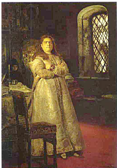
Царевна Софья Алексеевна. Художник И.Репин

В годы правления Софьи был заключен выгодный для России «Вечный мир» с Польшей (1686), Нерчинский договор с Китаем (1689) 1 , была образована Славяно-греко-латинская академия , а в Париже учреждено первое русское посольство. В 1687 и 1689 годах, под руководством князя Василия Голицына , были предприняты походы против крымских татар, но они были неудачными.