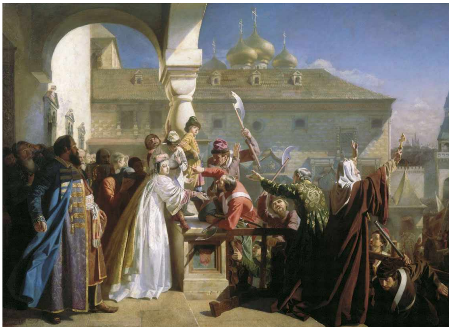
Н.К.Нарышкина показывает стрельцам царевичей Ивана и Петра.

чтобы им показали царевича Ивана. Наталья Кирилловна, чтобы успокоить бунтовщиков, вывела на Красное крыльцо Ивана с его сводным братом Петром, вместе с патриархом Иоакимом и боярами. Однако это не уладило бунтовщиков. В первые часы бунта были убиты бояре Артамон Матвеев и Михаил Долгорукий , потом и другие сторонники царицы Натальи, в том числе дядя Петра – Афанасий и Иван Нарышкины . Высшим начальником у стрельцов был популярный среди них князь Иван Хованский . По имени этого князя стрелецкий бунт 1682 года иногда в