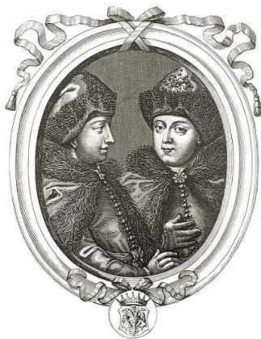
Цари Иоанн и Петр Алексеевичи.

Алексеевна приняла управление государством на себя по причине малолетства её братьев, а царица Наталья Кирилловна вместе с сыном ПЕТРОМ (вторым царём) должна была удалиться от двора в подмосковный дворец в селе Преображенском .