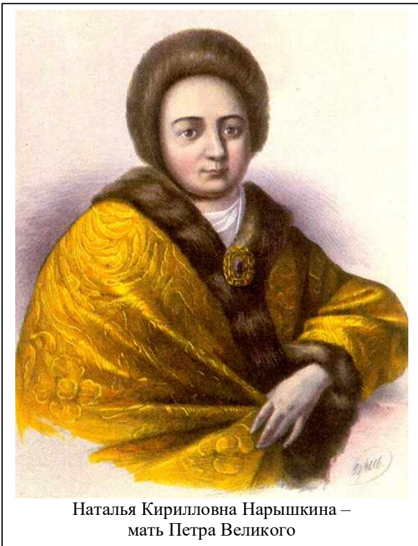
Наталья Кирилловна Нарышкина – мать Петра Великого

На предыдущих уроках мы говорили о том, что сын царя Алексея Михайловича Романова – царь Фёдор Алексеевич умер бездетным в возрасте 20 лет, не оставив завещания о престолонаследии. Вспомним также, что он был старшим сыном царя Алексея от первого его брака с Марией Ильиничной Милославской .