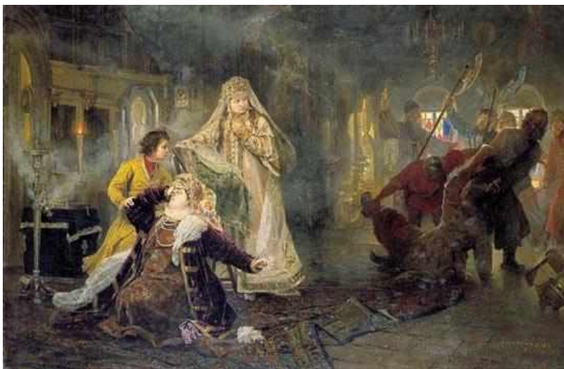
Царевич Петр утешает свою мать, а царица Софья с удовлетворением наблюдает, как стрельцы вытаскивают на расправу из дворца Ивана Нарышкина.

Выборные от стрелецких полков явились во дворец и потребовали, чтобы старший царевич Иван стал первым царём, а младший Пётр — вторым. Опасаясь повторения погрома, бояре согласились с их