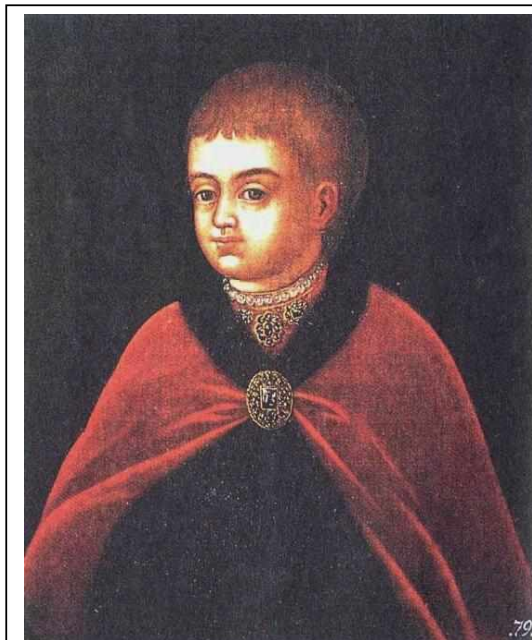
Пётр в детстве. Парсуна XVII века

Милославские не были согласны с таким решением. Они распустили слух о том, что будто бы царевич Иван задушен Нарышкиными. Стрельцы, которых было в Москве более 20 тысяч, двинулись к Кремлю с требованием,