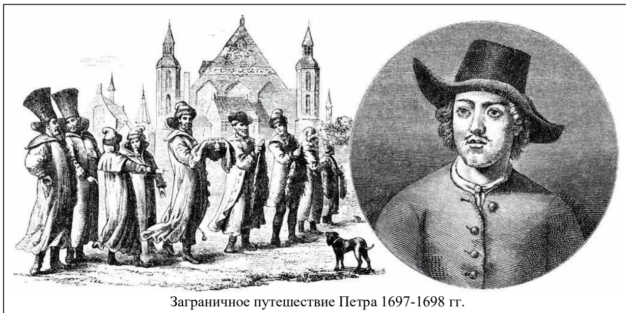
Заграничное путешествие Петра 1697-1698 гг.

Окрыленный успешной осадой Азова, Пётр укрепился в мысли, что для успеха в военных действиях России нужен сильный флот. Для постройки такого флота были нужны большие деньги. Чтобы их собрать были организованы кампании («КУМПАНСТВА») из крупнейших землевладельцев России. Было решено, что один корабль должен быть построен на средства с каждых 10.000 крестьянских дворов, принадлежавших светским владельцам и один – с каждых 8.000 крестьянских дворов, принадлежащих духовным владельцам . Городское сословие всего государства должно было снарядить 12 кораблей. Кумпанства просуществовали до 1700 года, когда они были отменены, а взамен был введен единый государственный налог «на починку кораблей и на покупку всяких корабельных припасов...».