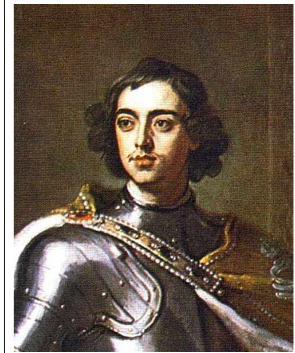
Петр в возрасте 26-ти лет. Худ. Кнеллер

После перехода власти от Милославских к Нарышкиным, начиная с 1689 года, ПЁТР стал единовластным царем. Его старший сводный брат – царь ИОАНН фактически отдал ему всю власть и не принимал участия в правлении, хотя до самой смерти в 1696 г. продолжал быть соцарём . Пётр поначалу не проявлял интереса к царской власти, отдав её на попечение своей матери и её окружения. Главными лицами, помогавшими Наталье Кирилловне Нарышкиной управлять государством, становятся патриарх Иоаким и Лев Кириллович Нарышкин . Прежде влиятельный Борис Голицын утратил свое положение, так как был заподозрен в сочувствии опальному князю Василию Голицыну , бывшему на стороне Милославских. По-прежнему, важное влияние на управлении царством оказывал князь Фёдор Ромодановский .