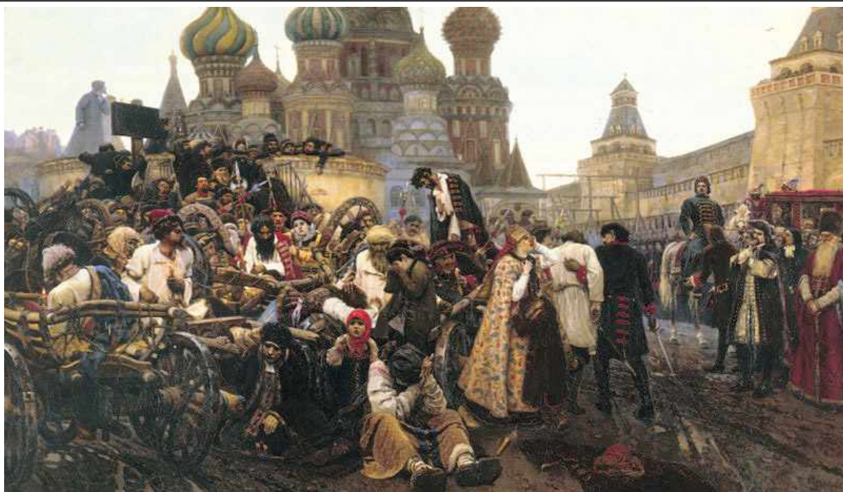
Утро стрелецкой казни. Художник В. И. Суриков

насилъно отправил в Суздальский монастырь, даже вопреки воле духовенства.