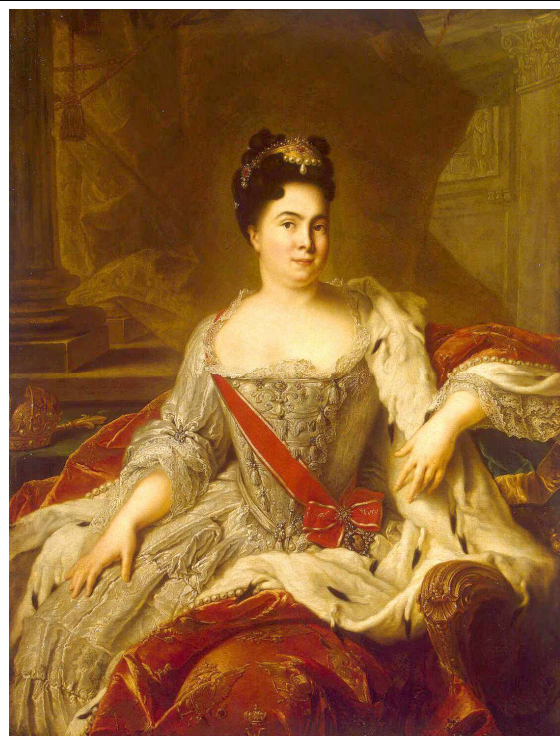
Екатерина I (Марта Скавронская)