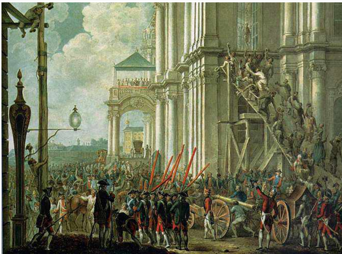
Дворцовый переворот 1762 г.

собственному желанию, но при этом выразил уверенность, что дворяне и впредь не будут укрываться от службы и не дерзнут детей своих оставлять без обучения «благопристойным наукам».