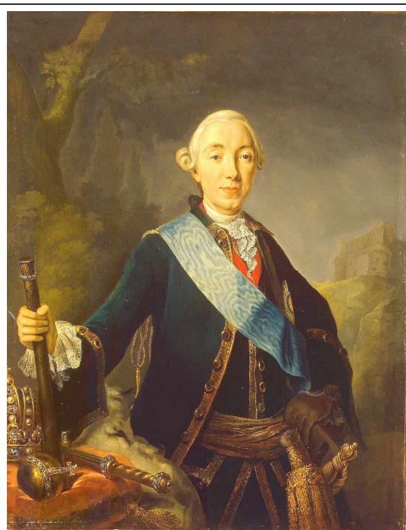
Портрет императора Петра III Фёдоровича 1761 г.

Напротив, Екатерина проявляла большой ум, любознательность и блестящие способности с раннего детства. Во дворце Елизаветы, куда привела её судьба, она должна была жить без родных и близких. Предоставленная самой себе, она начала читать и учиться. От лёгкого чтения она перешла к серьёзным трудам. Предметом её интересов были в основном французская философская и политическая литература. Мало-помалу она стала последовательницей идей Монтескье , Вольтера , «новой философии» века Просвещения . По силе ума и широте образования Екатерина была одной из самых выдающихся особ елизаветинского двора.