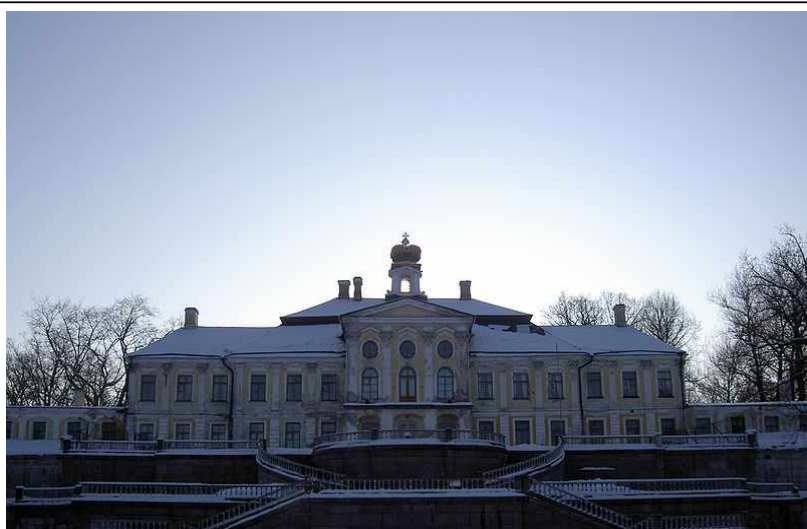
Дворец в Ораниенбауме

Лето 1762 г. Пётр III проводил в Ораниенбауме , а Екатерина – в Петергофе . Ранним утром 28 июня 1762 года Екатерина в