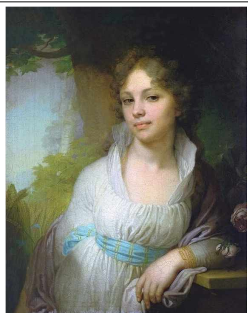
В.Боровиковский – портрет М.Лопухиной

Изобразительное искусство и архитектура. Русская живопись