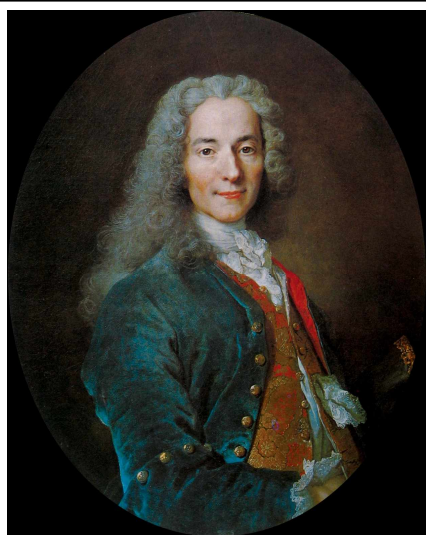
Вольтер (1694-1778) – французский философ-просветитель, оказавший большое влияние на взгляды Екатерины II.

Перелом в настроении императрицы к «вольнодумству» и