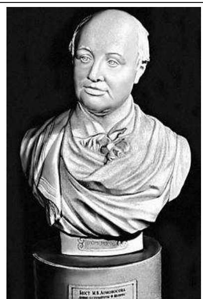
Ф.Шубин – бюст М.Ломоносова.

В области создании различных машин и механизмов особенно выделяются И.И.Ползунов и И.П.Кулибин. Ползунов изобрел первую паровую машину, а Кулибин разработал проект одноарочного моста через Неву. Кулибину также принадлежит изобретение семафорного