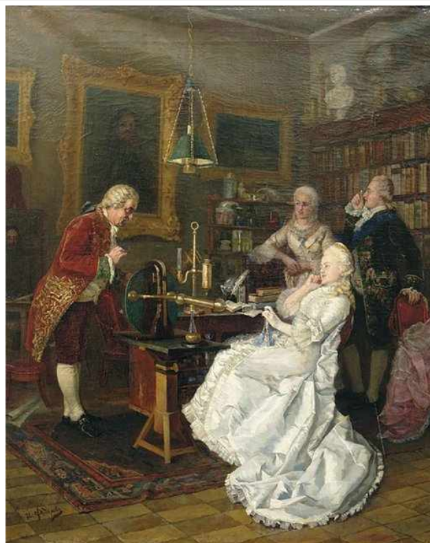
Екатерина II в гостях у Ломоносова

Сама императрица увлекалась сочинительством на исторические темы.