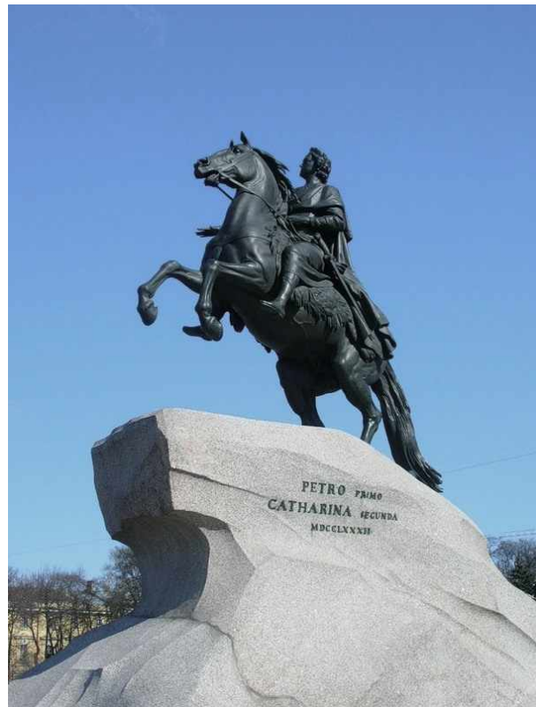
Э.Фальконе – памятник Петру I в С.Петербурге

С творчеством выдающегося скульптора-портретиста Ф.И.Шубина связано зарождение реалистического направления в портрете. Шубин, создал скульптурные портреты М.В.Ломоносова, Павла I, П.А.Румянцева-Задунайского, передающие в реалистичной форме внутренний и внешний мир человека и вошедшие в сокровищницу мирового искусства.