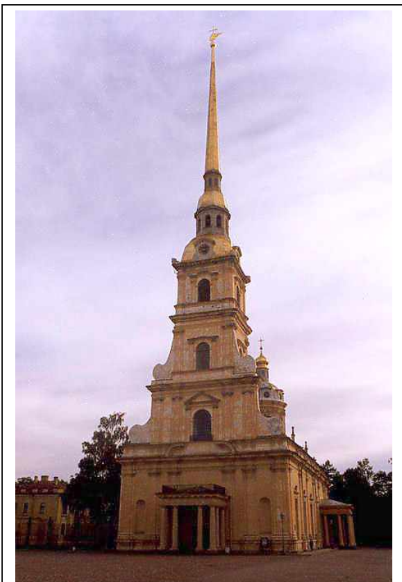
Архитектор Д.А.Трезини – Петропавловский собор

Слово «культура» происходит от латинского слова cultura , что означает земледелие, возделывание или воспитание . Часто понятие культура путают с искусством. Однако искусство является лишь частью культуры, которая включает в себя многие другие формы проявления характера, навыков, знаний, умений и других самовыражений человека .