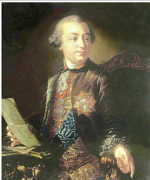
Граф Иван Иванович Шувалов

Одним из самых значимых событий в области образования и науки второй половины XVIII века стало открытие Московского университета . Он был создан в 1755 году по инициативе М.В.Ломоносова при активной поддержке графа И.И.Шувалова . Ломоносов составил для Университета план и программу обучения, подобрал преподавателей. По его настоянию лекции читались русскими профессорами и только на русском языке.