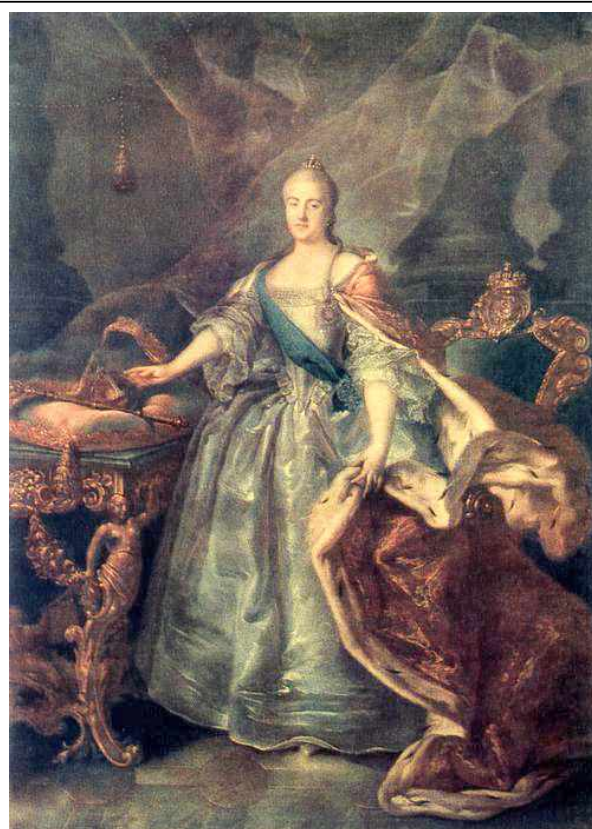
И.П.Аргунов. Портрет императрицы Екатерины II

Вершиной русского изобразительного искусства этого времени является портретная живопись, представленная творчеством таких мастеров как А.П.Антропов и И.П.Аргунов , а также художников, составивших новый этап в развитии портретного искусства: Ф.С.Рокотова , портреты которого отличаются человечностью и лирической глубиной; Д.Г.Левицкого , создавшего глубокие правдивые образы представителей разных слоев русского общества; В.Л.Боровиковского (рубеж XVIII - XIX вв.), портреты которого отличались исключительным лиризмом и красотой. Творчество В.Л.Боровиковского пронизано идеями сентиментализма . Он