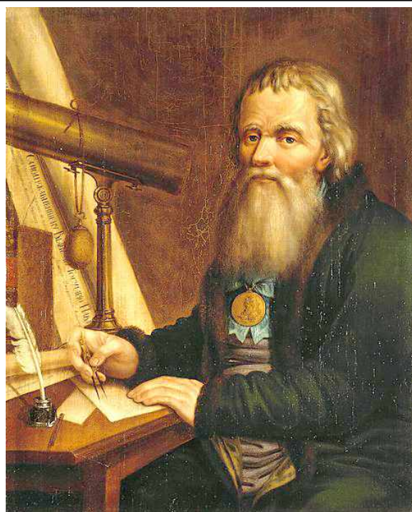
И.П. Кулибин (1735-1818)

Организовывались новые географические и этнографические экспедиции для разведки полезных ископаемых и изучения природных