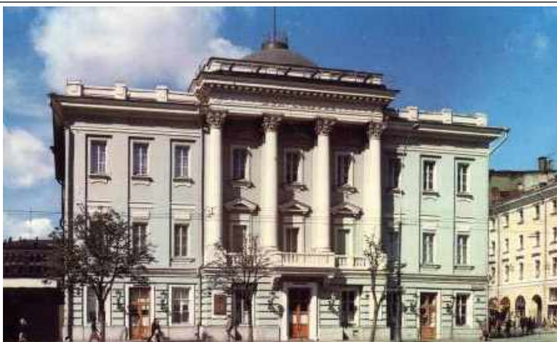
Архитектор М.Ф.Казаков – здание Дворянского Благородного собрания (ныне – Дом Союзов в Москве)

Во второй половине XVIII века, наряду с дворцовыми постройками и церквями, распространилось строительство государственных зданий, учебных заведений, больниц, театров и т.д. Строительство велось не