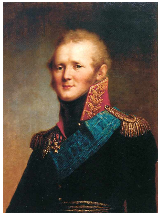
Император Александр Павлович (Благословенный)

Заговорщики, совершившие покушение на Императора Павла в ночь на 11-е марта 1801 года, действовали при молчаливом согласии наследника престола АЛЕКСАНДРА. О заговоре против отца цесаревич знал, но он не допускал мысли о возможности убийства. К тому же, в момент покушения Александр и его брат Константин находились под домашним арестом в Михайловском замке, не ведая даже за что их наказали. Когда граф Пален сообщил Александру о происшедшем, тот упал в обморок, а затем впал в сильнейшее смятение. Известны слова графа Палена: «C'est assez faire l'enfant! Allez régner!» (фр.) – «Прекратите быть ребенком! Идите царствовать!», которые заставили Александра совладать с собой. Однако его моральное состояние было очень тягостным: он смотрел на себя как на невольного соучастника убийства и опасался, что также на него могут смотреть и другие. Горше всего для Александра было то, что поначалу его супруга и мать отнеслись к нему с подозрением. Это сильно удручало его и делало глубоко печальным и безутешно тоскующим человеком.