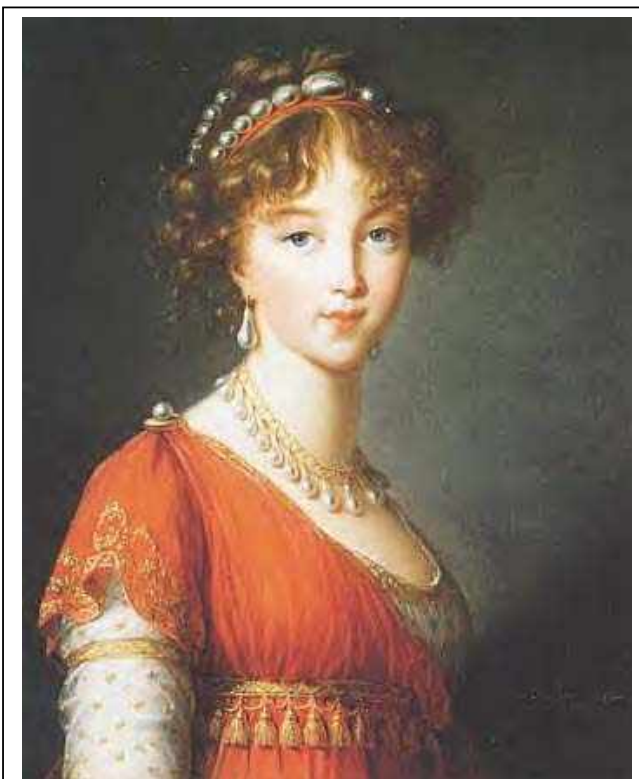
Елизавета Алексеевна – жена Александра I

Личность Александра станет нам более понятной, если мы