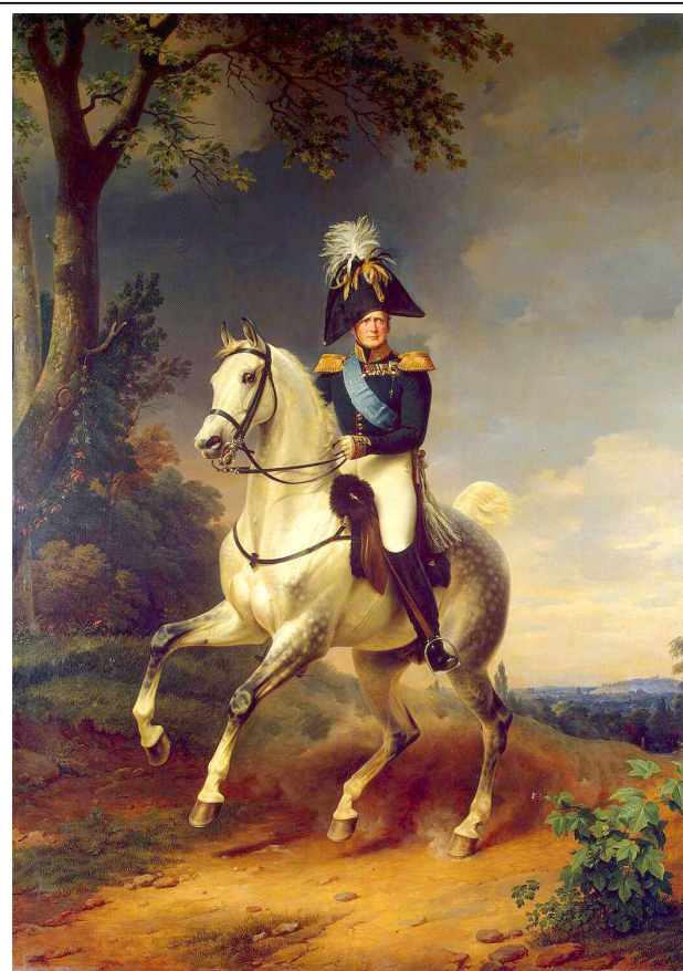
Конный портрет Александра I

В 1805 году по приказу Александра русские войска под командованием одного из учеников Суворова – Михаила Илларионовича КУТУЗОВА двинулись в Австрию для соединения с австрийскими войсками. Но раньше, чем они достигли театра военных действий,