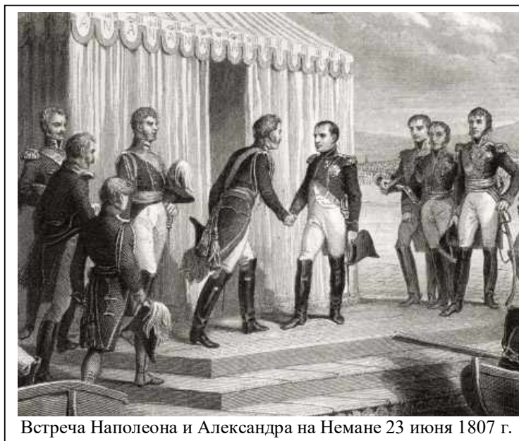
Встреча Наполеона и Александра на Немане 23 июня 1807 г.

В следующем, 1806 году император Александр возобновил войну против Наполеона в союзе с Пруссией. Однако Пруссия не дождалась русских войск и самостоятельно начала военные действия. Французы разбили пруссаков. Наполеон занял Берлин и овладел прусскими землями до самой Вислы. Надеясь на помощь русской армии, прусский король Фридрих-Вильгельм III укрылся со своим двором в Кенигсберге. Всю зиму 1806-1807 гг. шла кровопролитная борьба вблизи Кенигсберга.