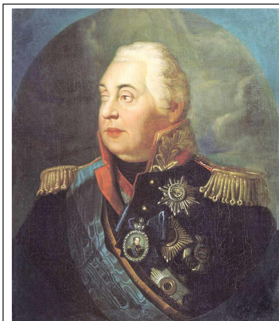
Михаил Илларионович Кутузов (1745-1813)

Вместе с русской армией из Москвы ушли почти все жители, увозя с собой всё, что только могли, оставив раненных на поле боя. Когда Наполеон вошёл в Москву он застал её совершенно опустевшей. Почти сразу после этого, по приказу генерал-губернатора Москвы Ф.В.Ростопчина город подожгли, превратив его в руины: в нём нельзя было зимовать, и нечем было питаться. В огне пожарища погибли около 25 тысяч раненных.