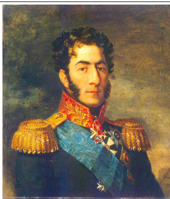
Петр Иванович Багратион (1765-1812)

В это трудное время, общее руководство над войсками получает Барклай де Толли . Александр I при этом уезжает в Москву, а затем в Петербург для общего руководства обороной государства. Барклай, понимая невозможность открытого боя с Наполеоном, повёл свою армию внутрь страны на Витебск и Смоленск, приказав Багратиону также отступать и идти с ним на соединение. Искусно уклоняясь от больших боев с неприятелем, Барклай без особых потерь довел свою армию до Смоленска и там соединился с Багратионом.