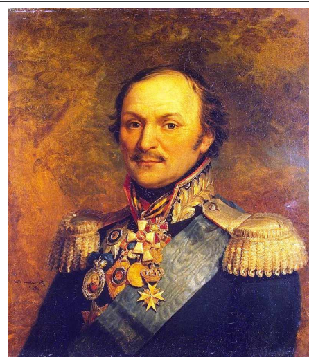
Матвей Иванович Платов (1753-1818)

Среди партизан своей отвагой прославился гусарский генерал и известный поэт Денис Давыдов . Также большой вклад в победу над французами внёс генерал от кавалерии, атаман Матвей Иванович Платов .