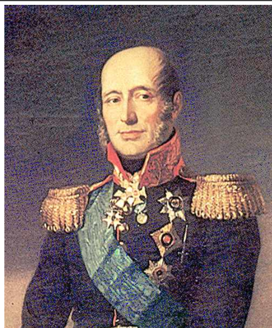
Михаил Богданович Барклай-де-Толли

Русские войска начали отступление, рассчитывая соединить свои армии воедино. Но сделать это им поначалу не удалось. Оказавшись отрезанными одна от другой, армии Барклая-де-Толли и Багратиона были настолько слабы, что по неравенству сил не могли и думать о генеральном сражении.