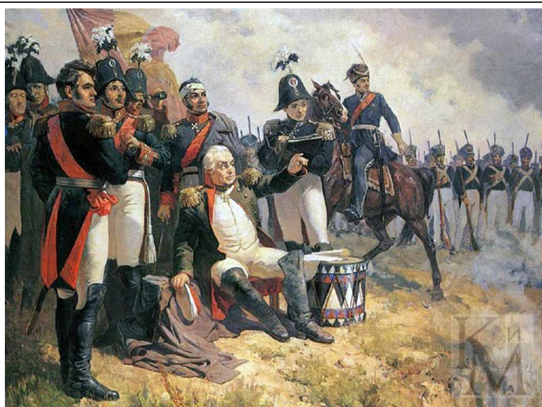
Бородинская битва 1812 г.

Наполеон пробыл в Москве 36 дней, трижды посылая находившемуся в Петербурге Александру I депеши с предложениями о мире. Но Александр не ответил ни на одну из них.