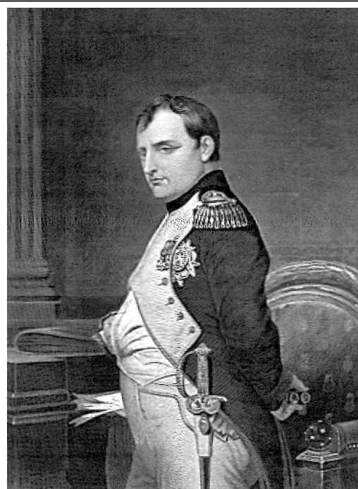
Наполеон Бонапарт (1769-1821)

Об этом мы поговорим на следующем уроке.