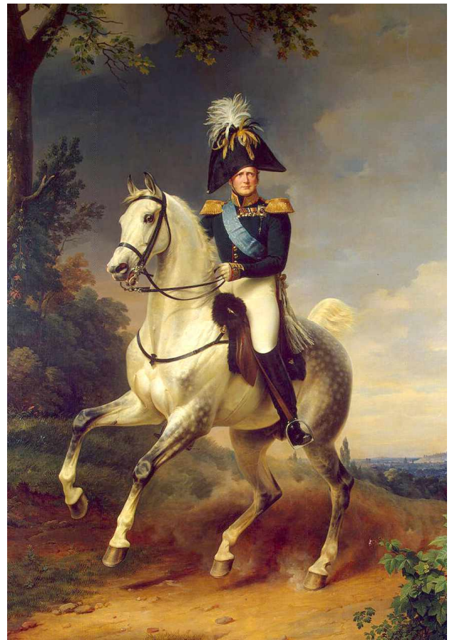
Александр I в 1812 г.

Обессиленная наполеоновскими войнами Франция не могла оказать большого сопротивления силам коалиции. Часть союзной армии отвлекла Наполеона от Парижа, а тем временем другая часть атаковала Париж, и без особого труда овладела им. В марте 1814 г. император Александр I в сопровождении прусского короля и австрийского императора торжественно въехал в Париж.