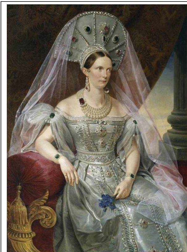
Александра Федоровна – жена императора Николая I

В силу своего положения, Николай о престоле и не помышлял, а занимался исключительно военными делами. Да и Александр I держал