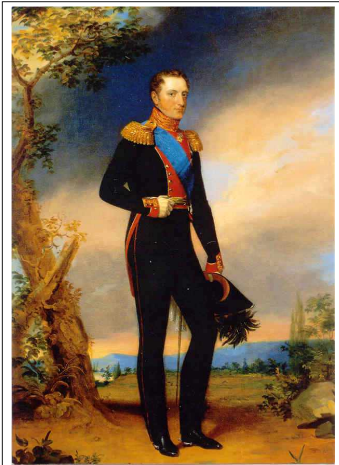
Николай I в юности

НИКОЛАЙ I Павлович родился в 1796 году и был третьим из четырех сыновей императора ПАВЛА I и императрицы МАРИИ ФЕДОРОВНЫ. У него было три брата: двое старших – Александр и Константин , и один младший – Михаил . Николай был почти на 20 лет моложе своих старших братьев и рос отдельно от них. К престолу его не готовили, поскольку считалось, что АЛЕКСАНДР должен стать наследником престола, а Константин – его приемником. Предназначение младших братьев, как и подобает великим князьям, должно было состоять в военной службе.