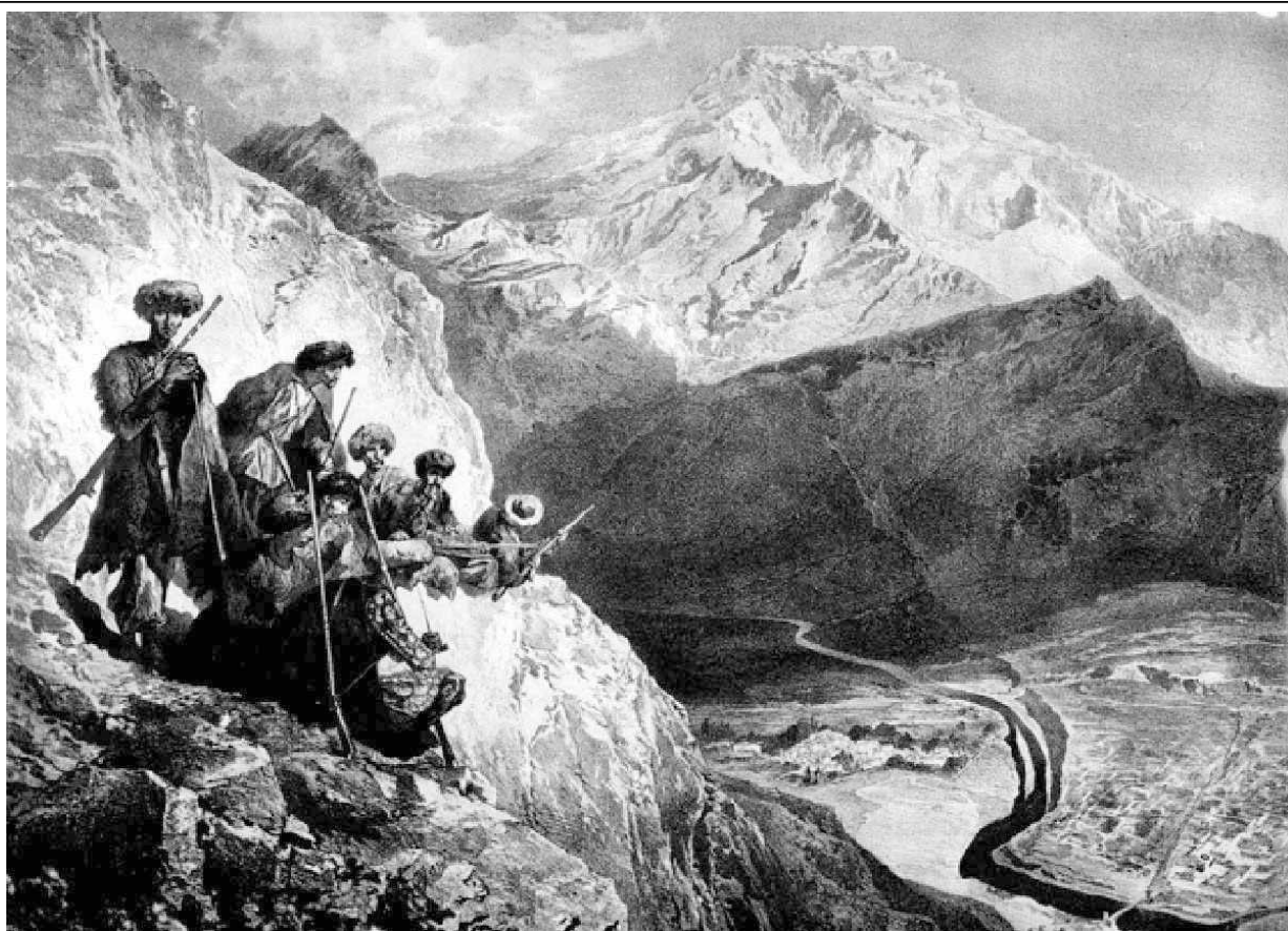
Эпизод войны с горцами

Кавказе. Под влиянием своих духовных предводителей – « имамов », они объявили русским священную войну – « газават ». Эта война продолжалась все царствование императора Николая I и закончилась только в 1864 году при императоре Александре II. Героями этой войны с русской стороны был генерал Ермолов , а со стороны горцев – имам Шамиль . Об этой войне мы ещё поговорим на следующих уроках.