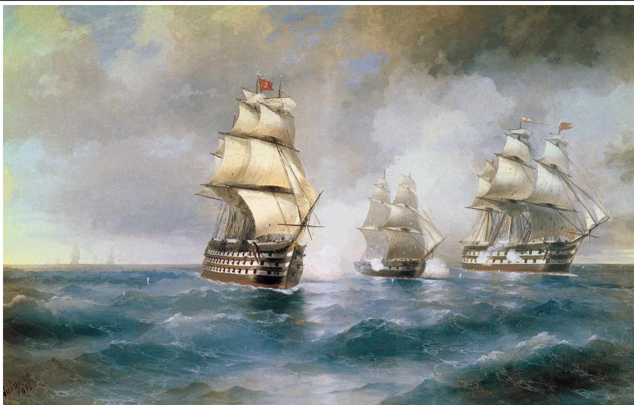
Бриг «Меркурий» в сражении с двумя турецкими кораблями. Худ. Иван Айвазовский

Героем войны стал капитан Казарский , который на бриге «Меркурий» отбил атаку двух более мощных турецких кораблей и вышел из боя победителем.