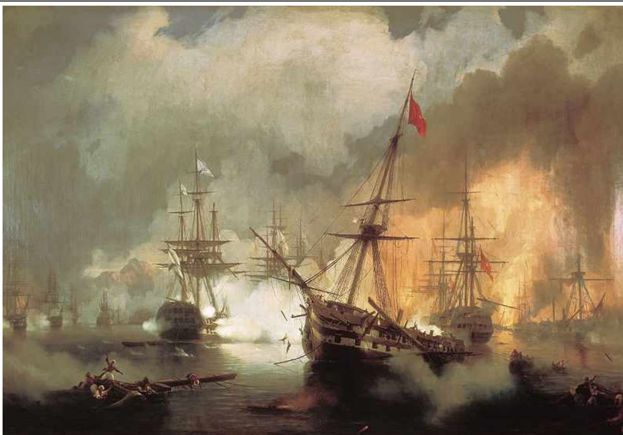
Битва в Наваринской бухте 1827 г. Художник Айвазовский

Вступая на престол, Николай I заявил о своем намерении "положить