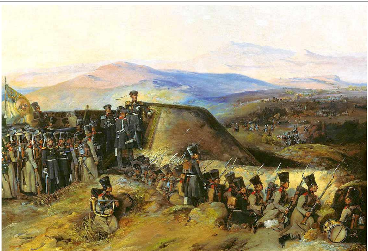
Боевой эпизод русско-турецкой войны 1828-1829 годов

успехом велись со времен царя Фёдора Алексеевича . Западные страны