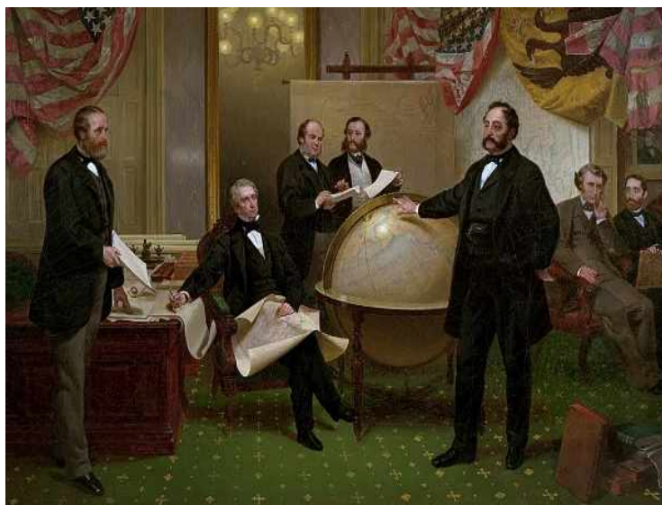
Подписание договора о продаже Аляски 30 марта 1867 года.

Когда стало понятно, что захват Англией Русской Америки неизбежен, встал вопрос о её продаже. Министр иностранных дел кн. Горчаков долго