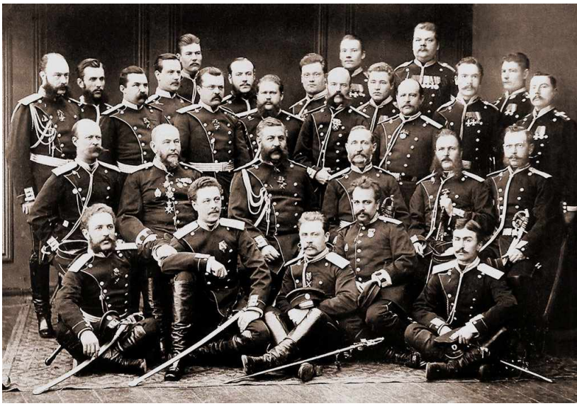
Офицеры и унтер-офицеры, участники русско-турецкой войны. 1878 г.

За выход в Средиземное море турки заставляли платить высокий налог.