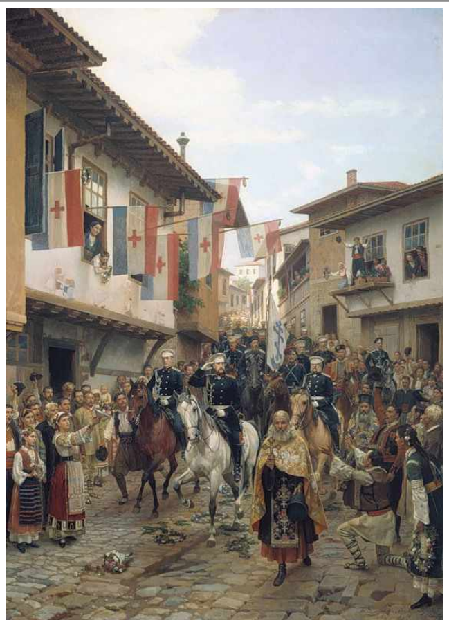
Въезд великого князя Николая Николаевича в Тырново 30 июня 1877 года

В ходе русско-турецких войн, начиная с XVIII века, царское правительство помимо военных результатов стремилось добиться от турецкой стороны уважения к проживавшим в Турции христианам. После неудачной для России Крымской войны, в Стамбуле решили больше не считаться с мнением русского царя. Преследования христиан возобновились с новой силой. В 70-е годы XIX века Турция