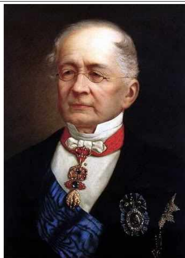
Александр Михайлович Горчаков

Внешнеполитическое положение России. Неудачная Крымская война ослабила международное положение России. Согласно Парижскому мирному договору 1856 года России запрещалось иметь в Чёрном море военно-морские силы, она теряла свои притязания на проливы Босфор и Дарданеллы и контроль судоходства по Дунаю . Влияние России, установленное в этом регионе ещё со времен Екатерины II во второй половине XVIII века, было сильно ослаблено.