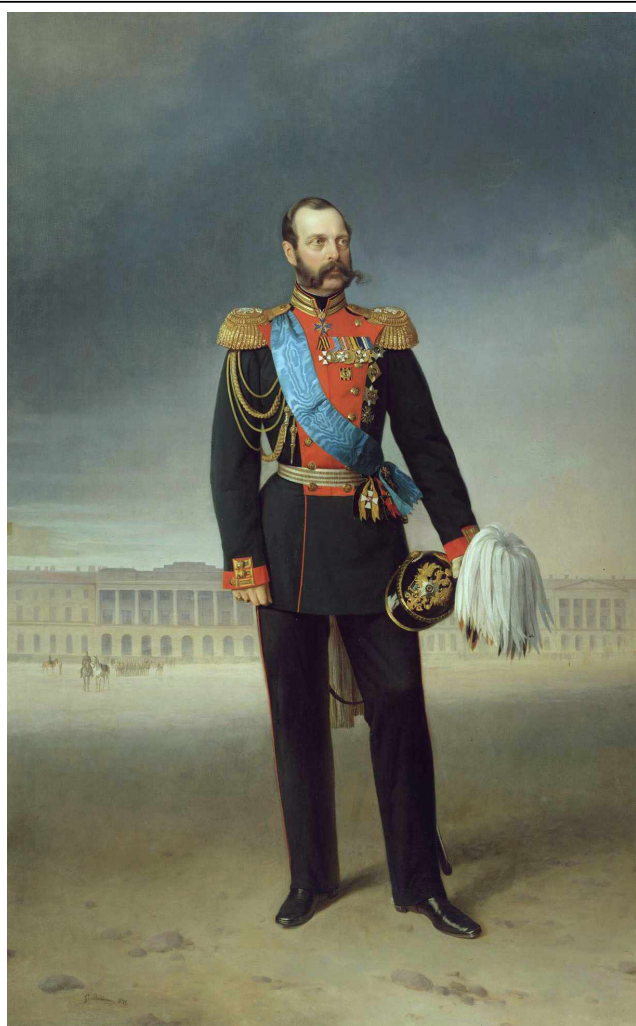
Император Александр II.

Будучи еще 7-ми летним мальчиком будущий император АЛЕКСАНДР II пережил восстание декабристов 1925 года. Его отец Николай I на протяжении всей своей жизни стремился к усилению законности, борьбе с беспорядками и укреплению монархии.