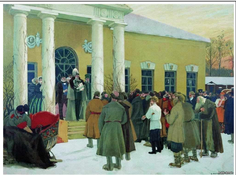
Чтение Манифеста об отмене крепостного права

Обсуждение проекта реформы самодержавия состоялось уже при Александре III. Несмотря на то, что подавляющее большинство министров высказалось «за», Александр III отклонил попытки демократизации монархической власти. Его решение было закреплено специальным Манифестом о незыблемости самодержавия, проект которого подготовил К. Победоносцев.