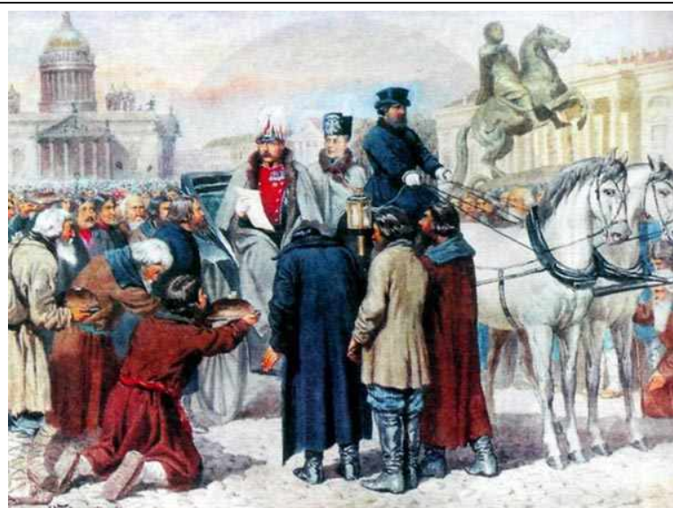
Александр II зачитывает Манифест 1861 года

Крестьянство, недовольное кабальными условиями Манифеста, ответило на него массовыми волнениями. В течение только 1861 года