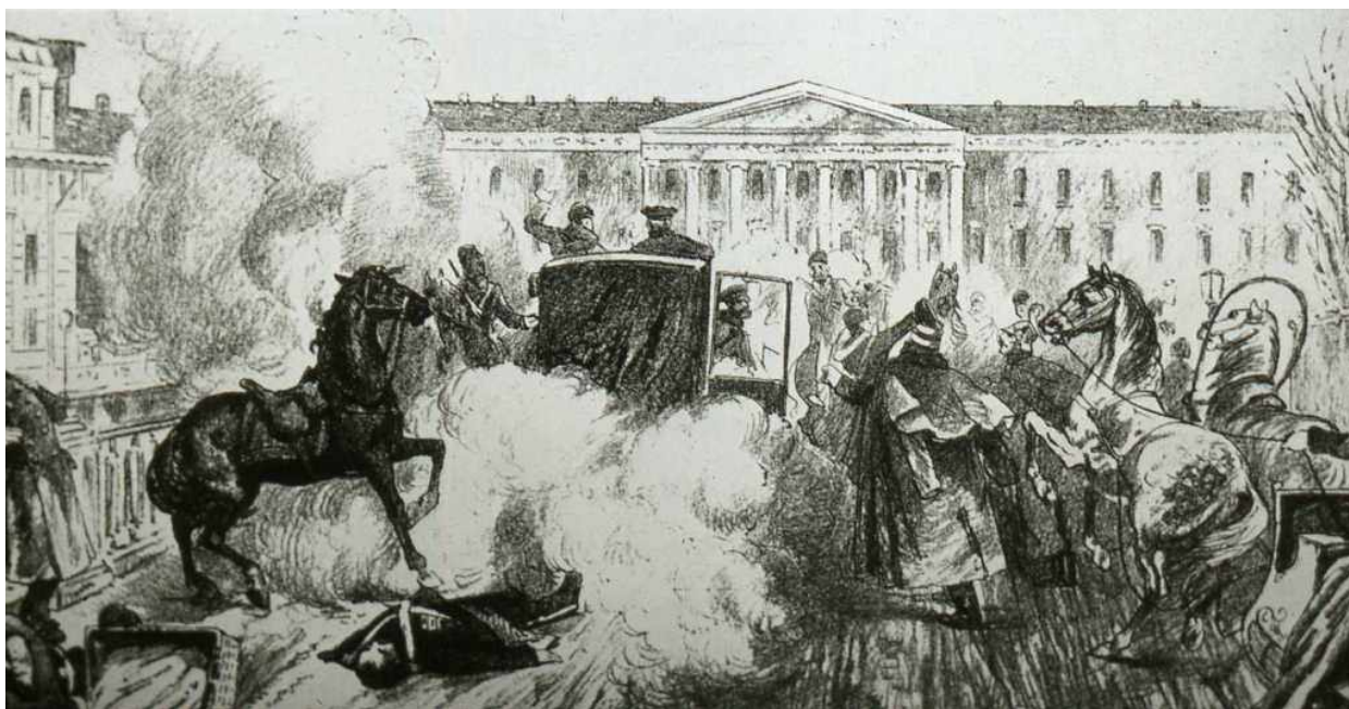
Террористический акт против царя Александра II – 1 марта 1881 г.

В воскресенье 1 марта 1881 года на берегу Екатерининского канала в