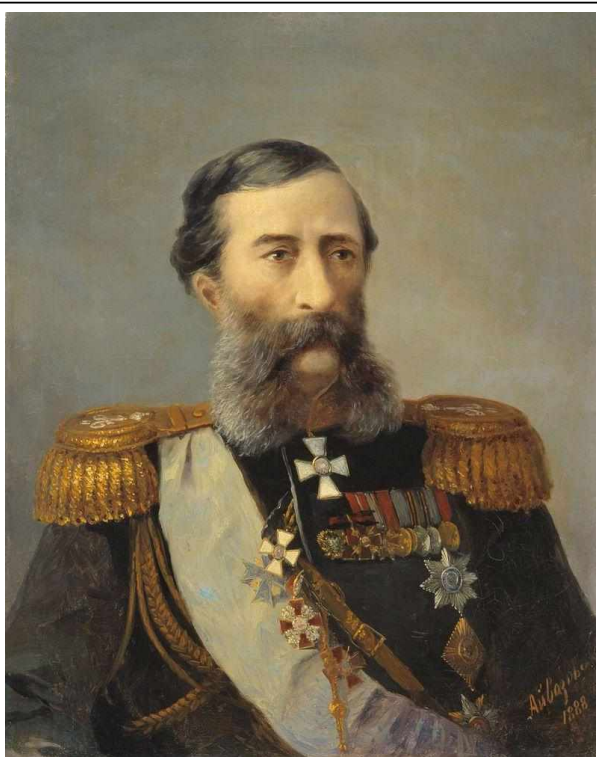
Н.Т.Лорис-Меликов – 1888 г.

Император был потрясен, но быстро пришел в себя и немедленно бросился к месту взрыва. На втором этаже дворца, где должен был состояться обед царской семьи, все было перевернуто, разбросана мебель, разбита посуда, вздыбился паркет. Царю доложили, что двумя этажами ниже, под караульным помещением, террористы заложили динамит. Взрыв прогремел в половине шестого вечера, как раз в то время, когда должен был начаться обед. По счастливой случайности трапеза в этот день задержалась. Никто из членов императорской фамилии не пострадал, но погибло 13 солдат караула, а 45 было ранено. Царь распорядился подготовить список вдов и сирот. Все они получили щедрое пособие.