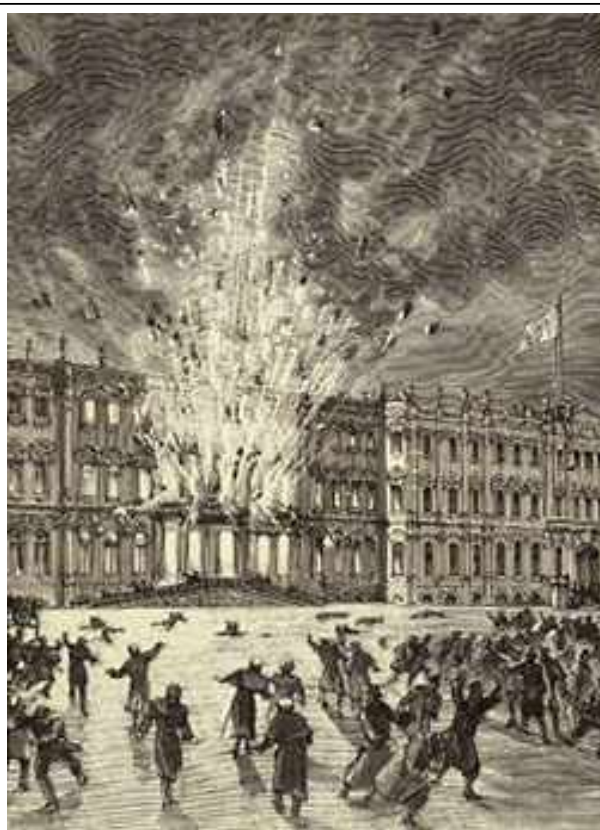
Взрыв в Зимнем Дворце 5 февраля 1880 г.

Затем были и другие покушения, но пятая попытка стала известна всей стране. 5 февраля 1880 года произошел взрыв в главной императорской резиденции в Петербурге – Зимнем дворце. Во время взрыва Александр II мирно беседовал с одним из государственных чиновников.