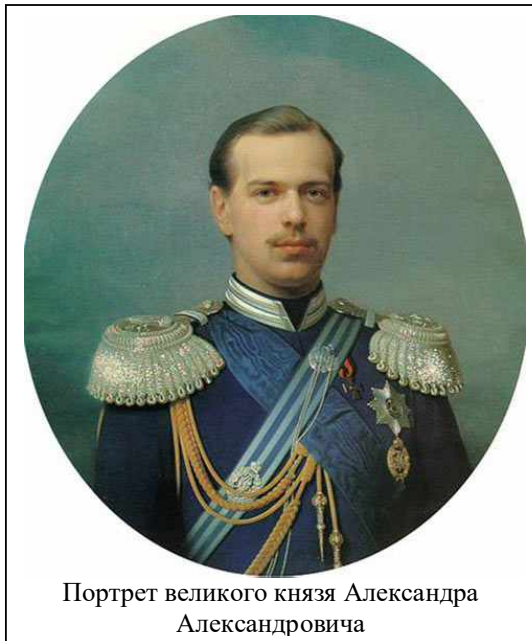
Портрет великого князя Александра Александровича

Александр III родился 26 февраля 1845 года и был вторым сыном императора Александра II . Он не готовился наследовать престол, и получил, как подобает великому князю, в основном военное образование. Однако когда ему было 20 лет, его старший брат Николай внезапно скончался. Александр был провозглашён цесаревичем и наследником престола.