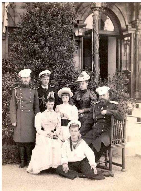
Семейная фотография. Слева направо: цесаревич Николай, великий князь Георгий, императрица Мария Фёдоровна, великая княжна Ольга, великий князь Михаил, великая княжна Ксения и император Александр III.

монеты и ломал подковы. В манере его одеваться было что-то нарочито непритязательное. Его часто можно было видеть в солдатских сапогах с заправленными в них по-простецки штанами. В домашней обстановке он носил русскую рубаху с вышитым на рукавах цветным узором.