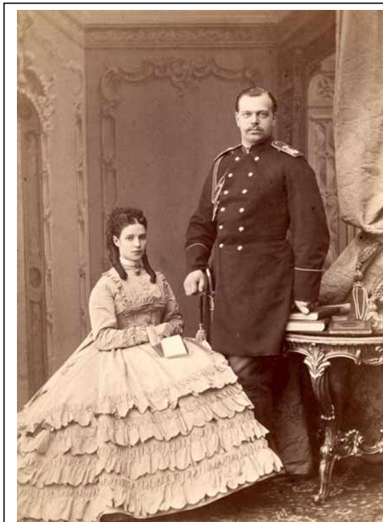
Наследник цесаревич Александр Александрович со своей супругой цесаревной и великой княгиней Марией Фёдоровной

По характеру, привычкам и своему складу ума Александр был решителен и прямолинеен. Он был высокого роста (193 см) и обладал в юности незаурядной силой – пальцами гнул