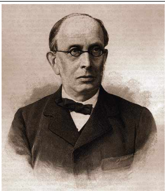
Константин Петрович Победоносцев (1827-1907)

На посту министра внутренних дел Лорис-Меликова сменил генерал от инфантерии Н.П.Игнатьев . Он предложил Александру III созвать Земский собор для обсуждения проблем развития местного самоуправления. В