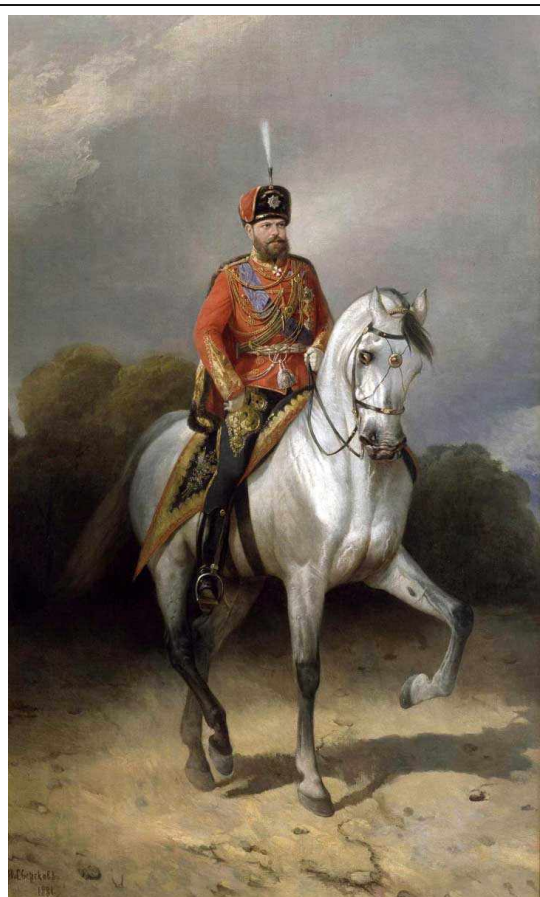
Портрет императора Александра III в мундире лейб-гвардии Гусарского полка.

Царствование императора Александра III было ознаменовано периодом небывалого мира. Россия не вела ни одной войны. За поддержание европейского мира Александр III получил название Миротворца.