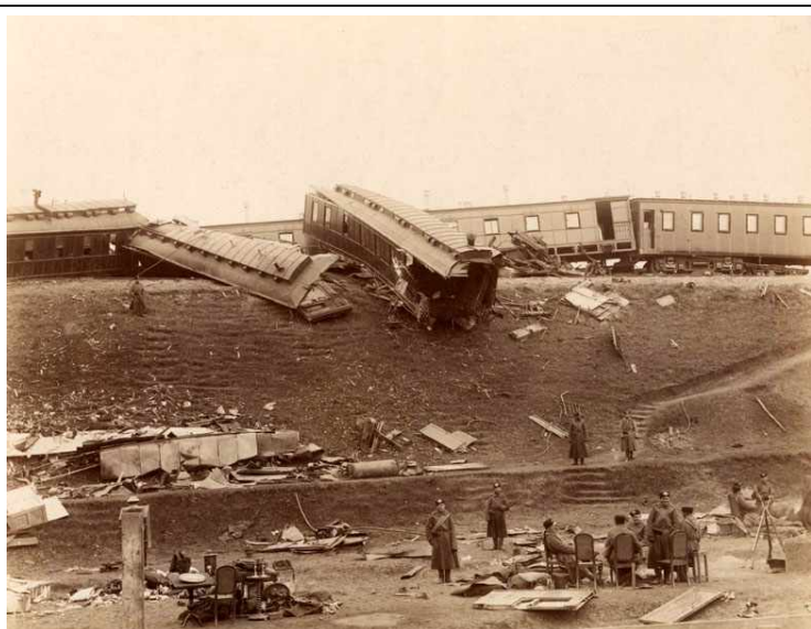
Крушение императорского поезда 17 октября 1888 года.

Россия, Германия и Франция заявили официальный протест и заставили Японию отказаться от Ляодунского полуострова. По соглашению с Россией Япония получала право держать свои войска в Корее. Россия становилась соперницей Японии на Дальнем Востоке. Из-за отсутствия дорог, слабости военных сил на Дальнем Востоке Россия была не готова к военным столкновениям и старалась их